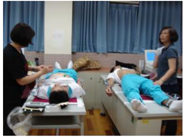
國、高中受檢百分比