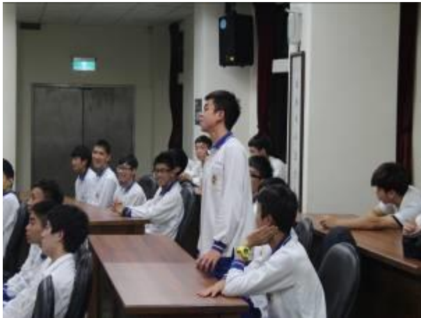
學生回答講師問題

主題： 103 學年度體育班 運動訓練與管理專題報告活動 時間： 103 年 11 月 28 日 地點： 綜合教學大樓 5 樓研討室