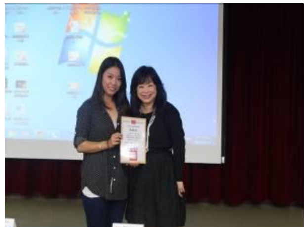
校長頒發感謝狀給講師