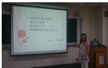
郁暉老師分享物理科試題分析結果