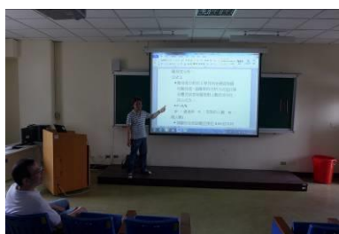
建儀老師分享生物科試題分析結果