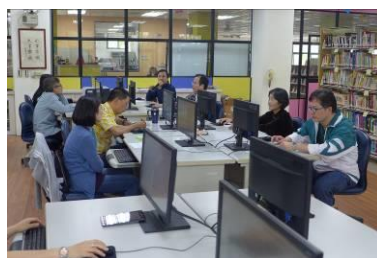
自然科研習-威力導演教學應用