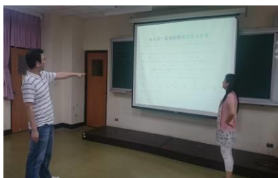
老師們針對分享內容進行討論交流