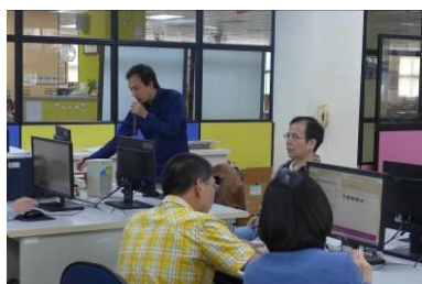
自然科研習-威力導演教學應用