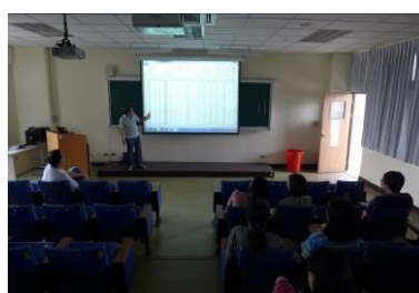
建儀老師分享生物科試題分析結果