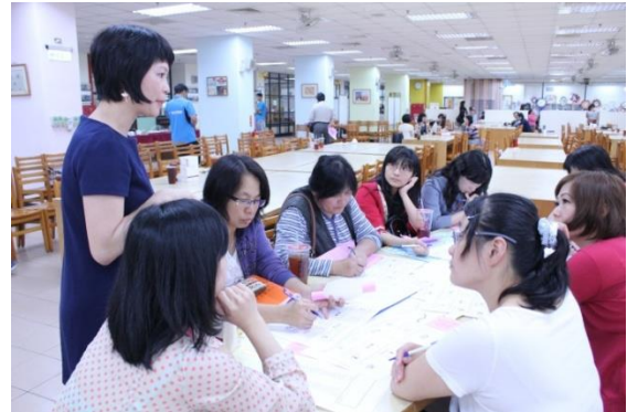
班級經營社群分享班級策略法寶書