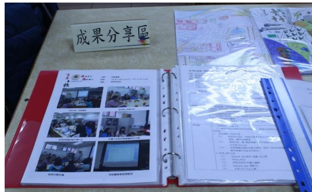
創意閱讀成果手工書製作~閱讀與表達