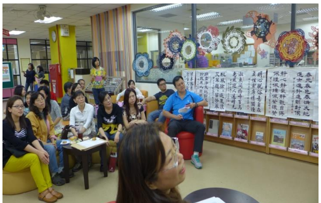
老師們專注聆聽的學習風景~游於藝