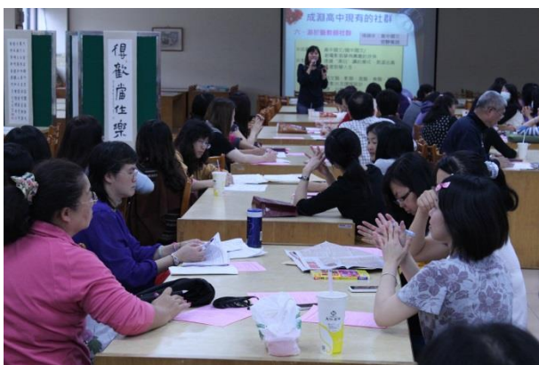
教務主任簡介校內各個社群