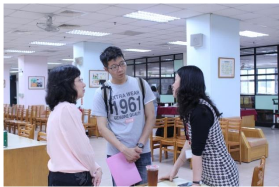
資訊創新科技教學社群—IRS 體驗