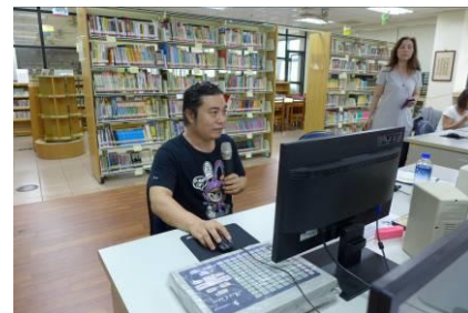
講師介紹新的訊息