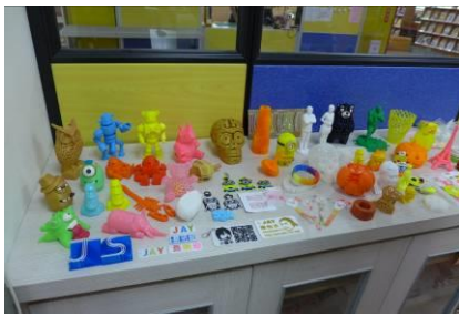
講師 3D 列印作品展示