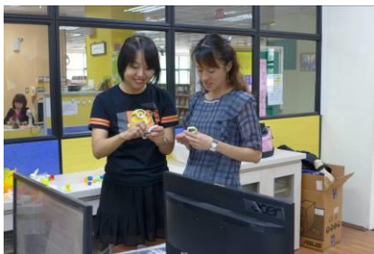
分享 3D 列印之應用