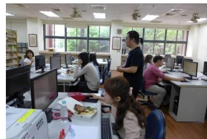
講師指導教師操作軟體