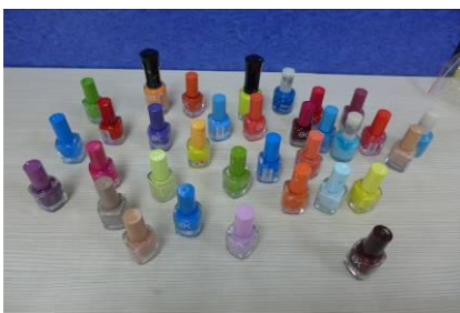
列印成品上色工具