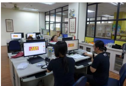
講師講解 3D 列印操作