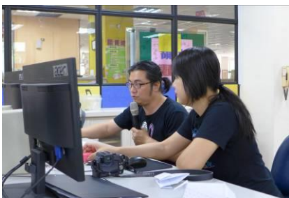
助教協助 3D 列印教學