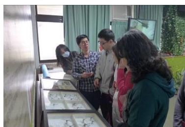
老師們討論昆蟲館陳列標本