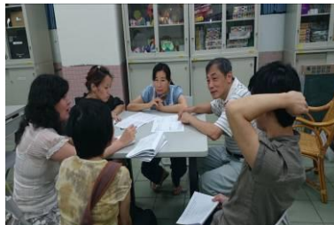
高三數學任課老師討論段考試題分析結果