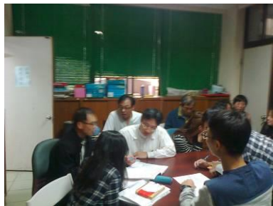
因應 107 課綱的課程設計研討