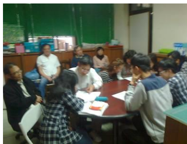
數學任課老師研議補救教學措施