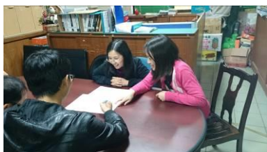
高一數學任課老師討論段考試題分析結果