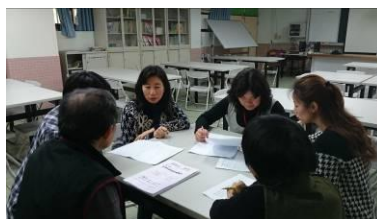
高三數學任課老師討論段考試題分析結果