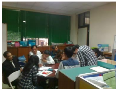
因應 107 課綱的課程設計研討