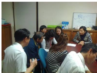
數學任課老師研議補救教學措施