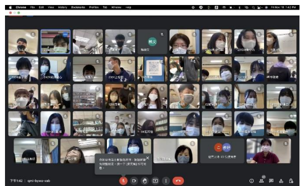
線上交流結束的大合照