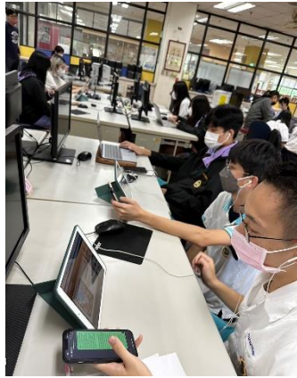
同學專注於線上交流互動

主題：日本飯山高校線上交流成果 時間：111年11月18日 12:45-14:00 地點：圖書館檢索區