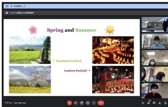
飯山高校同學的簡報分享