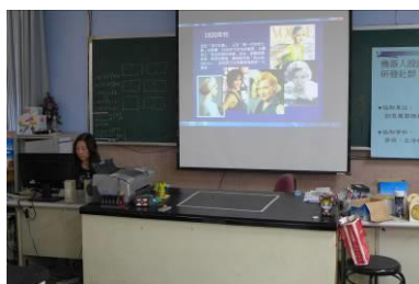
玉雯老師分享議題融入教學實作影片