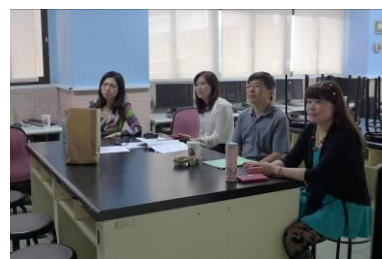
老師們觀看議題融入教學實作影片