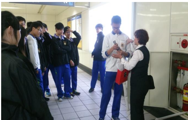
滅火設施說明及操作練習