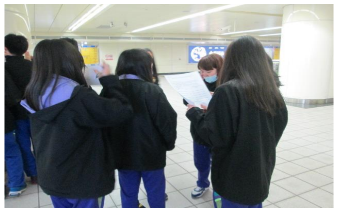
參訪結束問題解答與問卷填寫