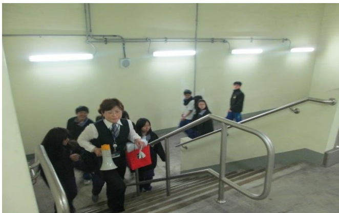
捷運站逃生路線實際演練