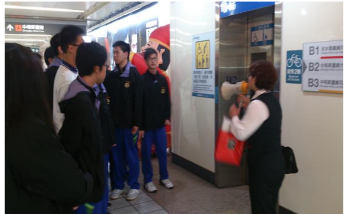
電梯搭乘注意事項說明