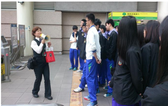
捷運搭乘禮節說明