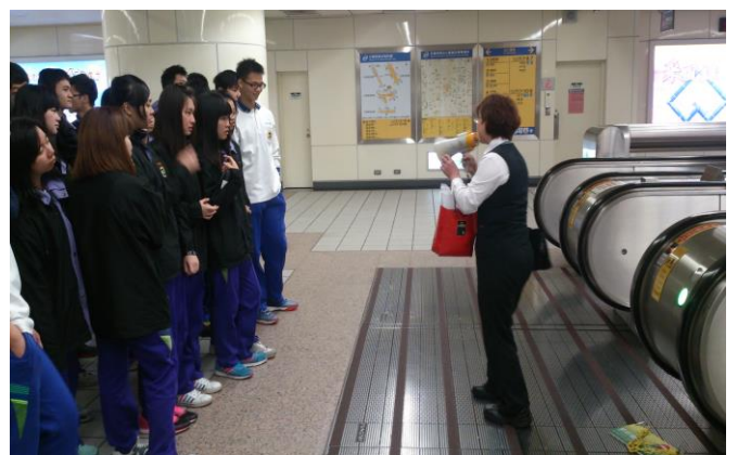
電扶梯搭乘禮節及注意事項說明