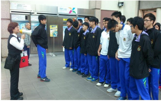
同學捷運站集合即行前說明

主題： 103 學年度 捷運站參訪(105 班) 時間： 104 年 3 月 3 日 (二) 地點： 民權西路捷運站蘆洲線