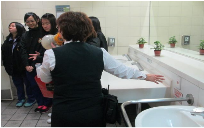
廁所緊急呼叫設施說明

主題： 103 學年度 捷運站參訪(105 班) 時間： 104 年 3 月 3 日 (二) 地點： 民權西路捷運站蘆洲線