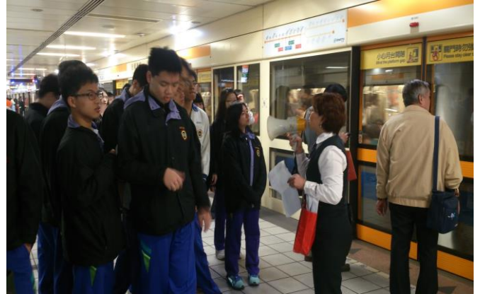
捷運搭乘禮節及注意事項說明