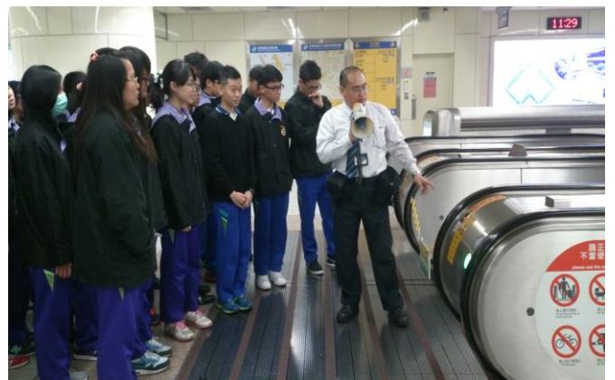
電扶梯搭乘及注意事項說明