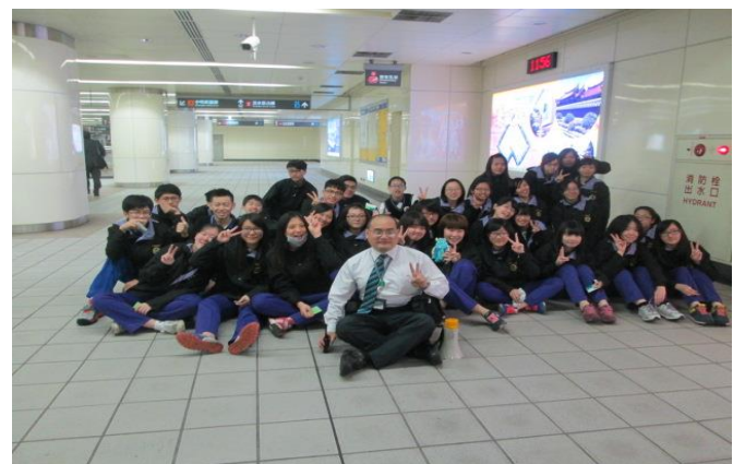
參訪結束與站務人員快樂合影