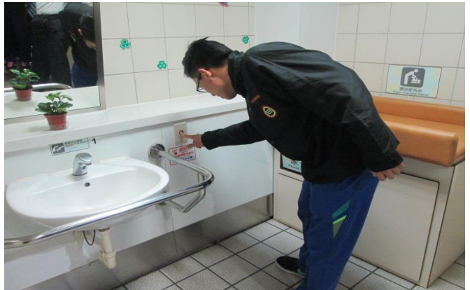
廁所緊急求救設施說明