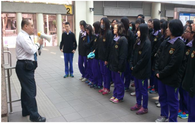
同學捷運站集合及行前說明

主題： 103 學年度 捷運站參訪(106 班) 時間： 104 年 3 月 3 日 (二) 地點： 民權西路捷運站蘆洲線