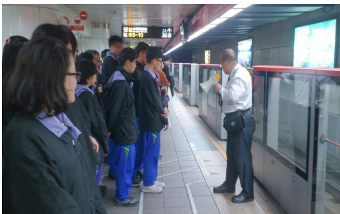
捷運搭乘禮節及注意事項說明