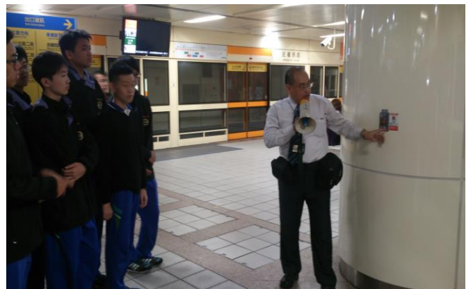
緊急設施使用說明