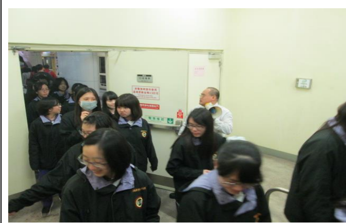
緊急逃生口說明及實際演練

主題： 103 學年度 捷運站參訪(106 班) 時間： 104 年 3 月 3 日 (二) 地點： 民權西路捷運站蘆洲線