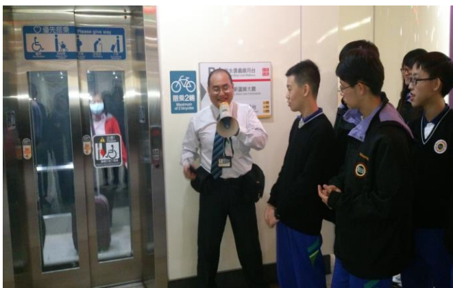
電梯搭乘及注意事項說明