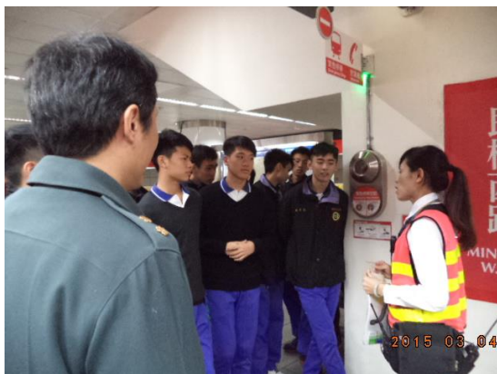
緊急停車按鈕說明