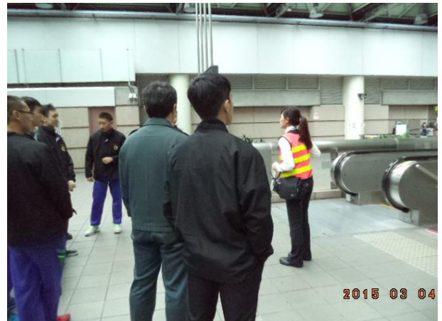
電扶梯搭乘禮節說明