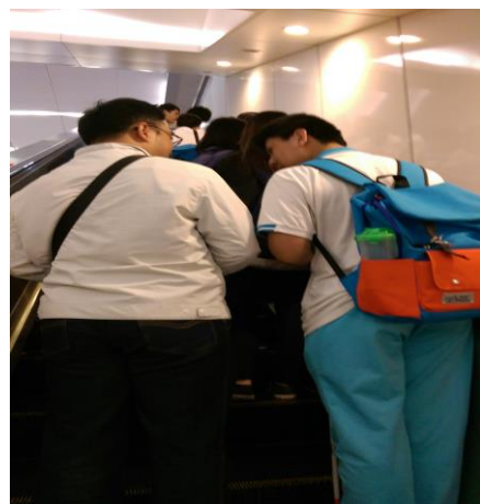
視障同學體驗搭乘電扶梯