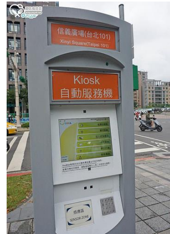
UBIKE 服務中心外自動服務站