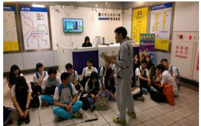
Q & A 時間 1