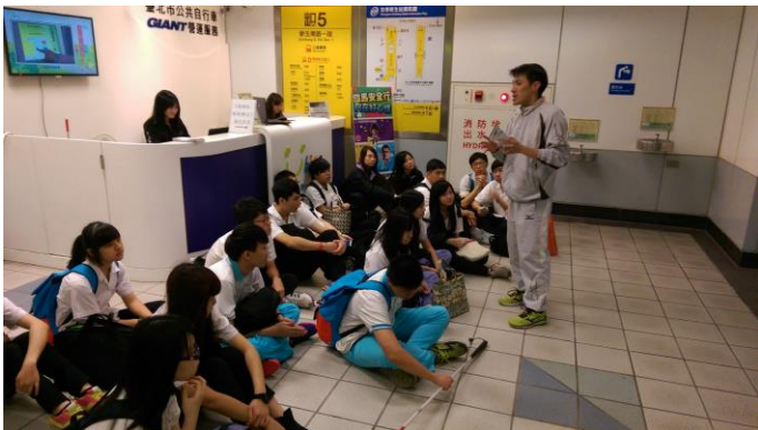
教官解釋 UBIKE 服務中心運作流程 1