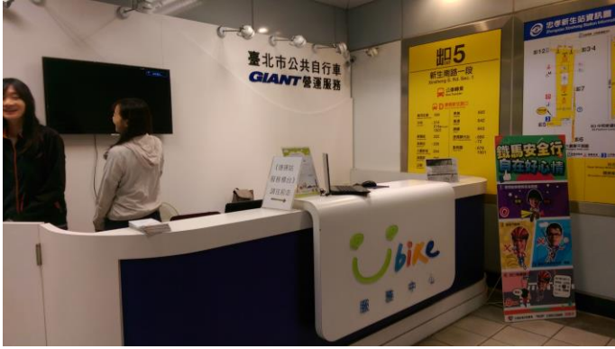
忠孝新生站 UBIKE 服務中心

主題： 春暉社-參觀忠孝新生站 UBIKE 服務中心 時間： 104 年 4 月 17 日 地點： 忠孝新生站 UBIKE 服務中心