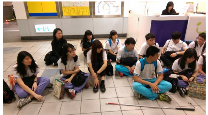
視障學生聆聽 UBIKE 服務中心運作