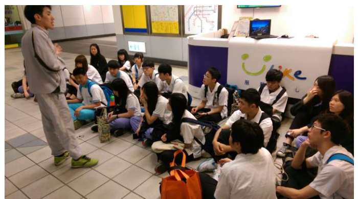
教官解釋 UBIKE 服務中心運作流程 2