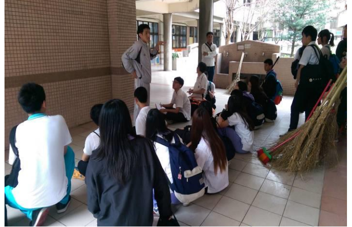
教官出發前安全任務提示