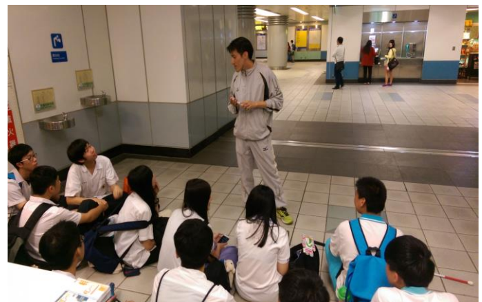
Q & A 時間 3