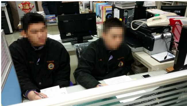
法令宣導暨交通安全教育影帶觀賞