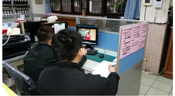
法令宣導暨交通安全教育影帶觀賞