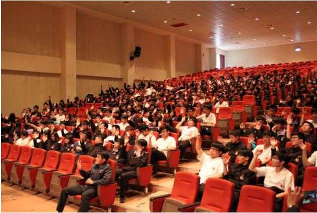
體驗植物人一天的生活(1)

主題： 103 學年度第二學期 高二交通安全-保腦宣導 時間： 104 年 03 月 27 日 (五) 地點： 活動中心 3 樓音樂廳