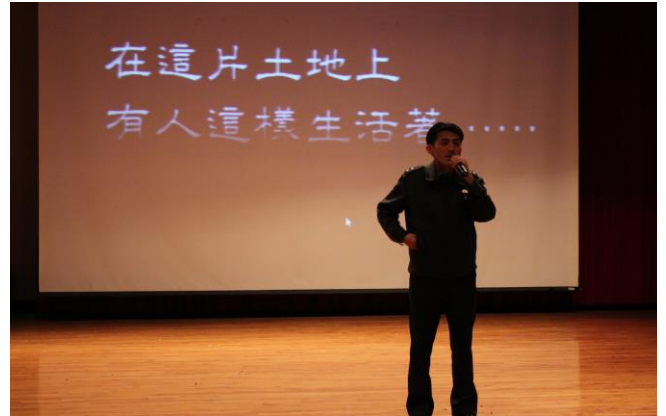
代主任教官開場與介紹講師