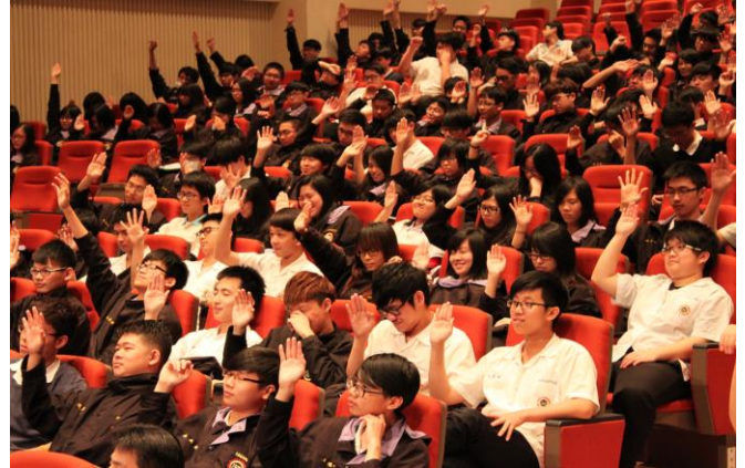
體驗植物人一天的生活(2)