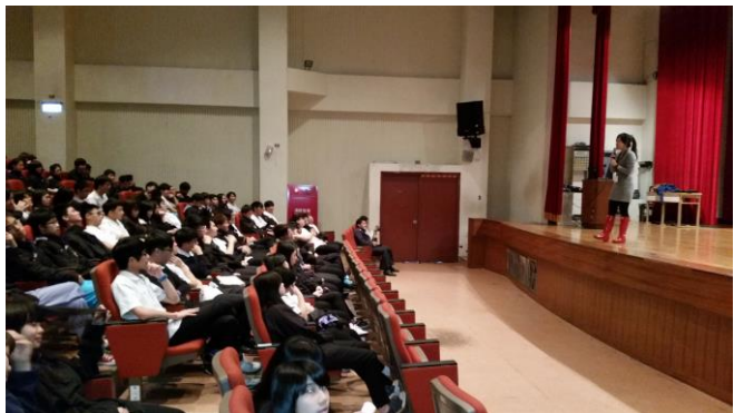
講師實施交通宣教(1)