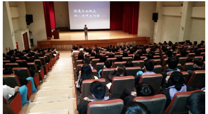
講師實施交通宣教(2)