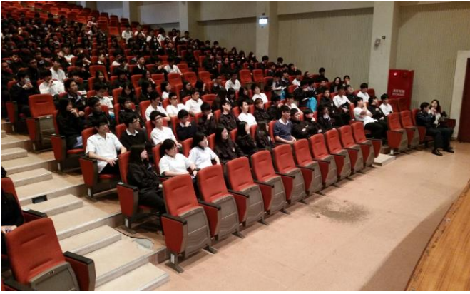
高二實施交通安全宣教

主題： 103 學年度第二學期 高二交通安全-保腦宣導 時間： 104 年 03 月 27 日 (五) 地點： 活動中心 3 樓音樂廳