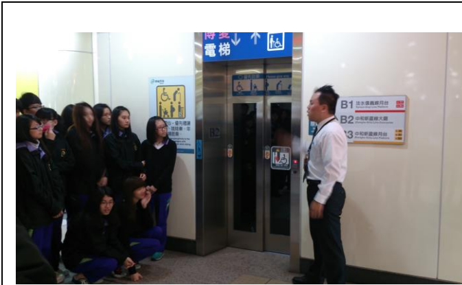
電梯搭乘注意事項說明

主題： 103 學年度 捷運站參訪(110 班) 時間： 104 年 1 月 26 日 (一) 地點： 民權西路捷運站蘆洲線