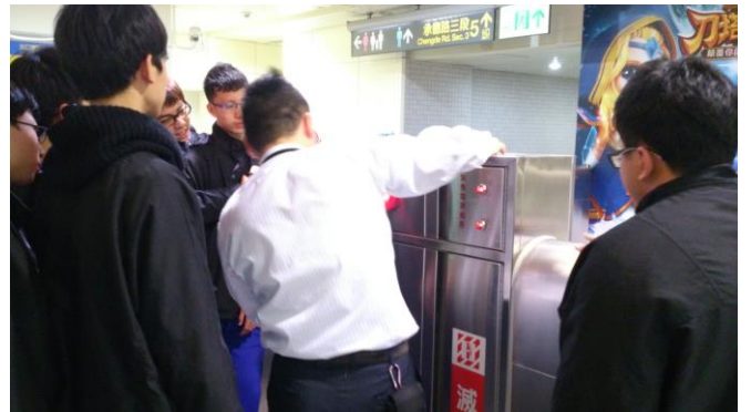
緊急停車按鈕說明