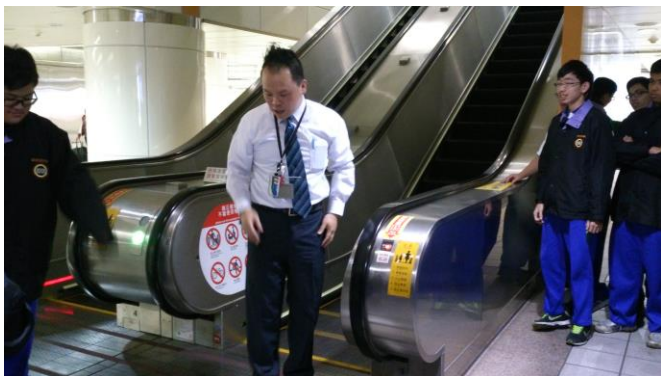
電扶梯搭乘禮節說明