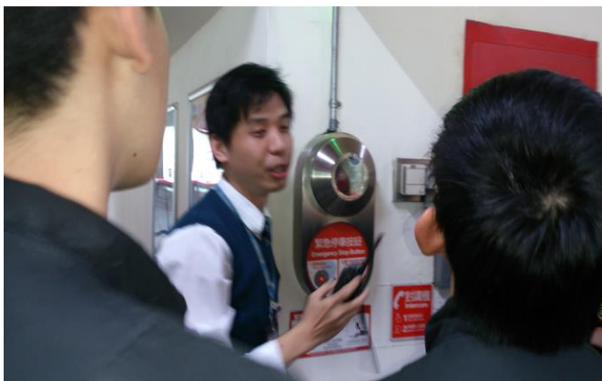
緊急停車按鈕說明