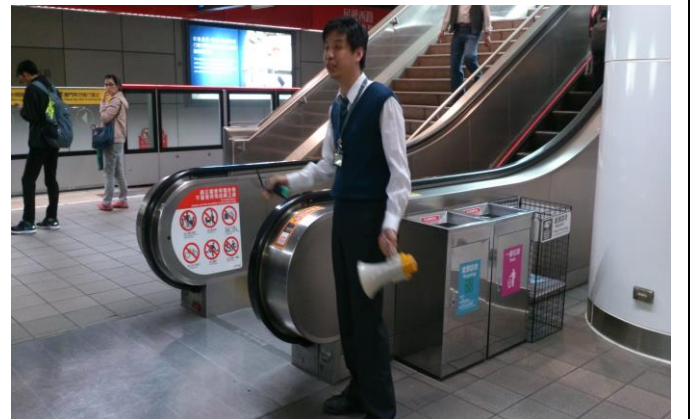
電扶梯搭乘禮節說明