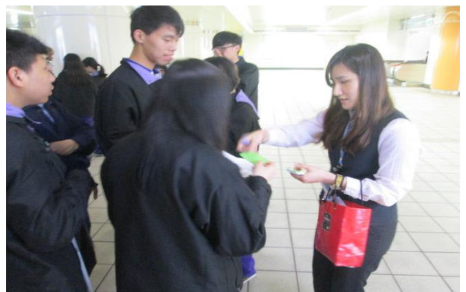
頒發紀念品(單程票卷)