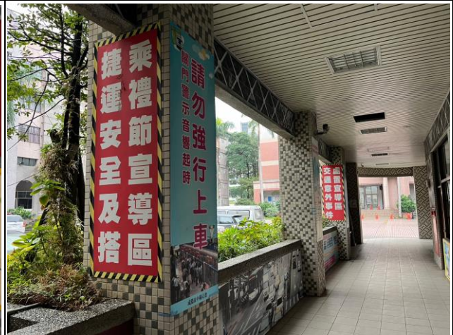
宣導捷運搭乘禮儀