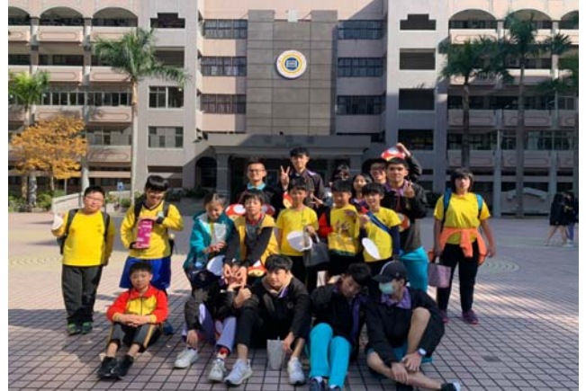
大小學伴團康時間