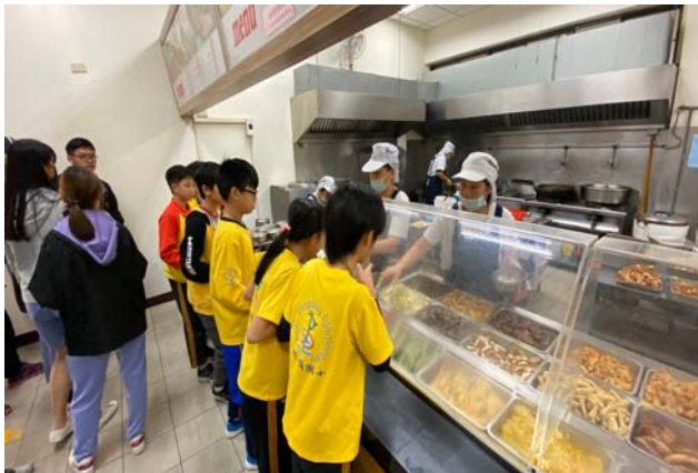
大小學伴於熱食部用餐