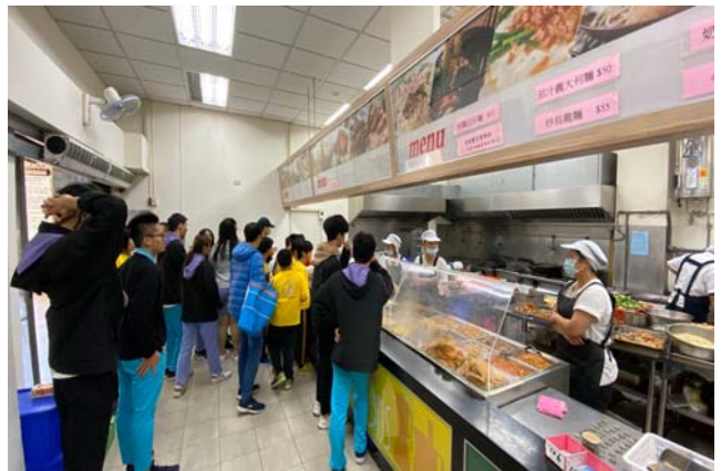
大小學伴於熱食部用餐