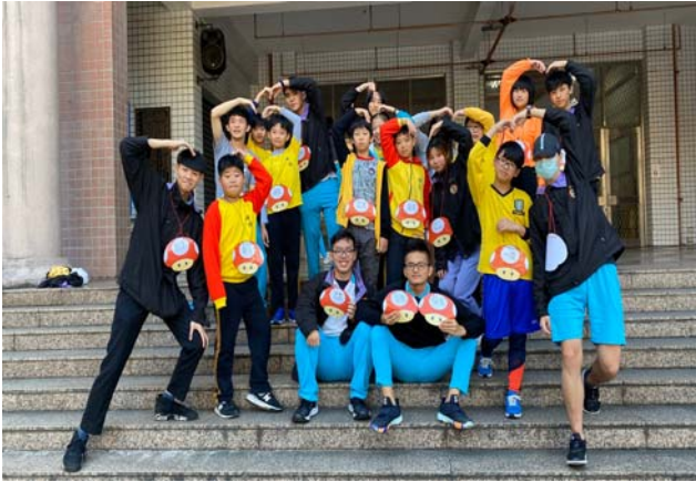
大小學伴團康時間