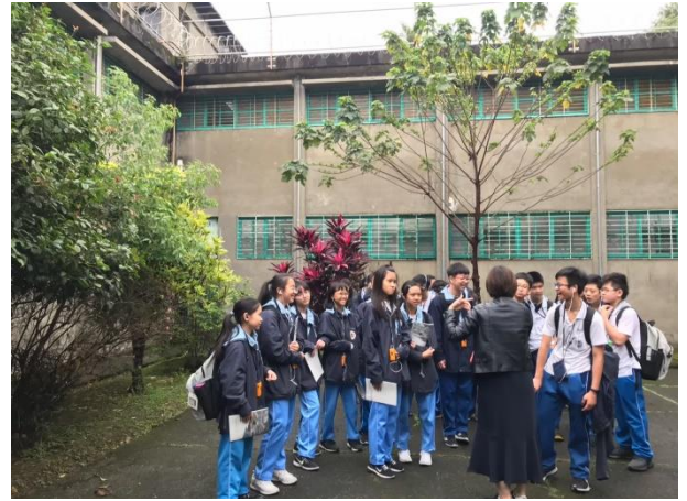
導覽員人帶學生參訪園區