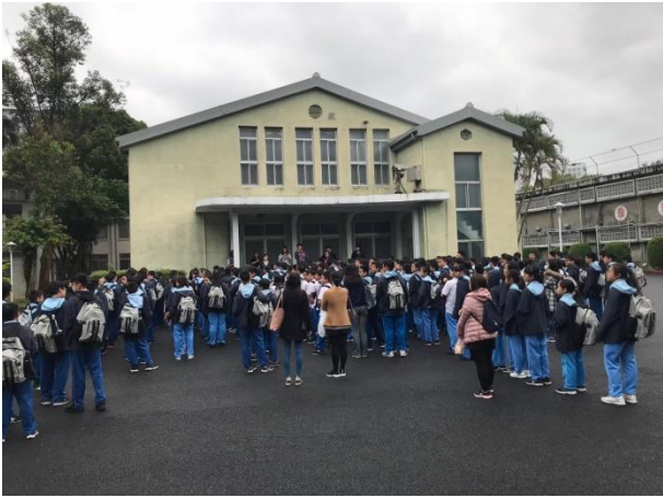
生教組長集合國七於文化園區進行參訪說明

主題： 友善校園品德、法治教育-景美人權文化園區參訪 時間： 108年4月3日 地點： 成淵高中