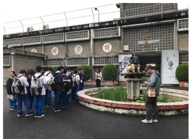
學生參觀解豸水池