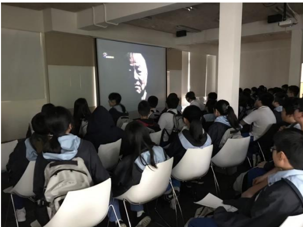
受難者影片享親身經歷