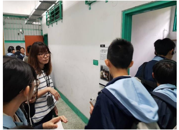
白色恐怖關押住所