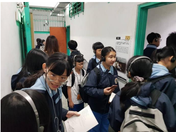
學生隊於關押住所感到好奇