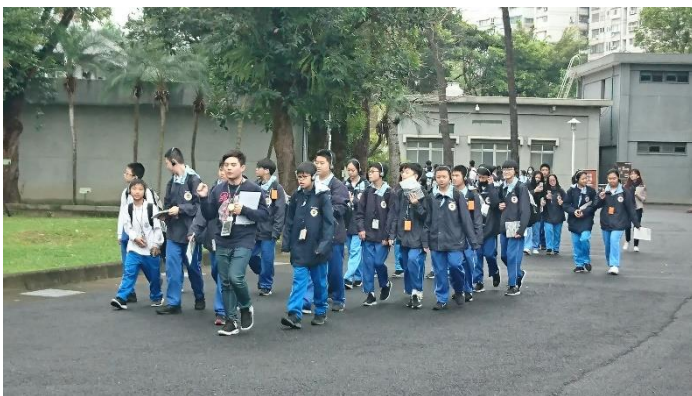
分站講師帶著學生前往參觀地點