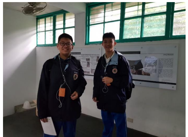
兩位學生分享參訪心得