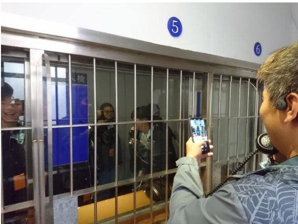
參訪受刑人與親友會面處