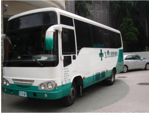
新生 X 光篩檢現場環境及安全設置