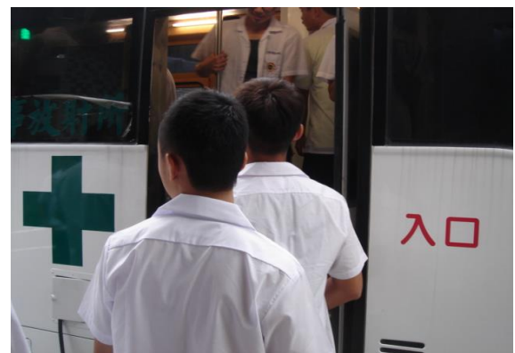
受檢學生排隊上 X 光車