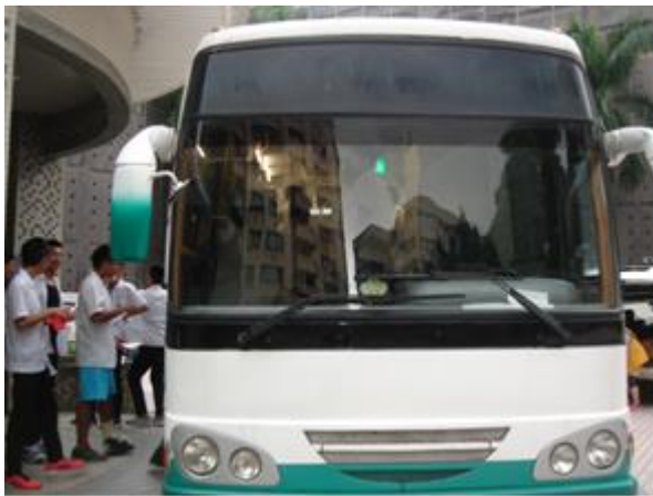
受檢學生排隊上 X 光車