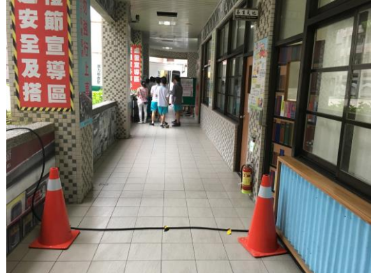
新生 X 光篩檢現場環境及安全設置