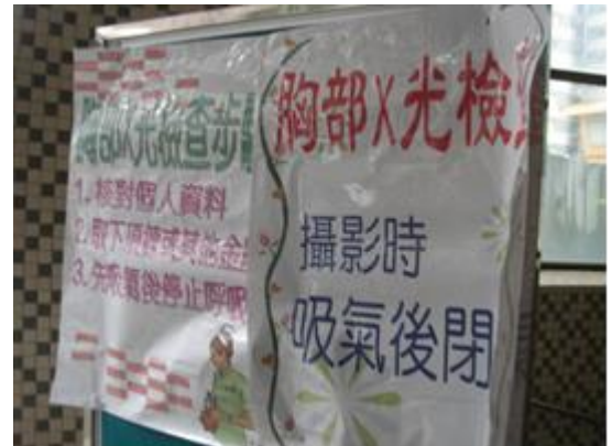
X 光檢查前說明事項