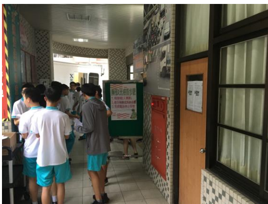
受檢學生排隊上 X 光車