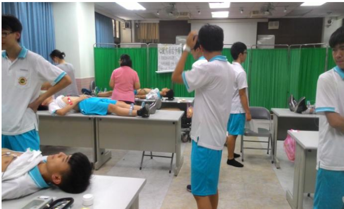
男同學依序入內等待檢查