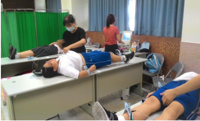
國中部女同學心臟病篩檢實況

主題：心臟病篩檢 時間：106年09月25日篩檢 106年10月19日補檢 地點：語言教室(一)