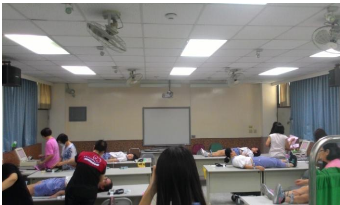
高中部女同學心臟病篩檢實況