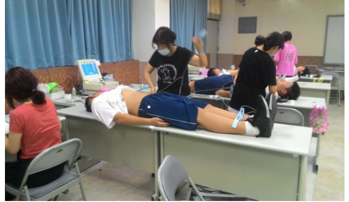
國中部男同學心臟病篩檢實況