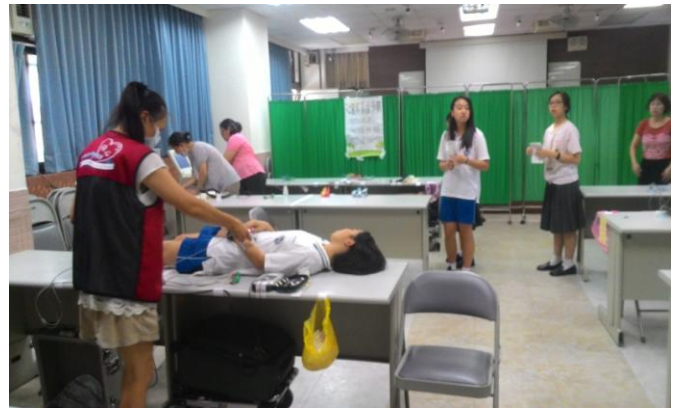
女同學依序入內等待檢查