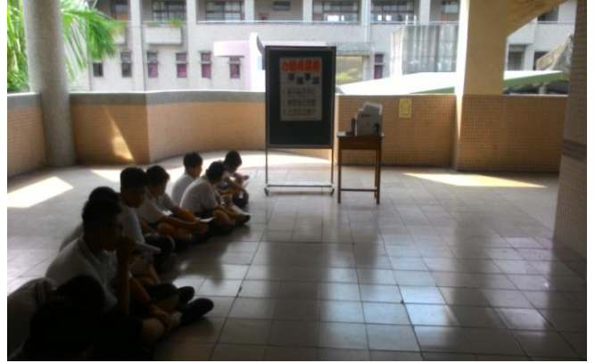
學生進行檢查前準備動作