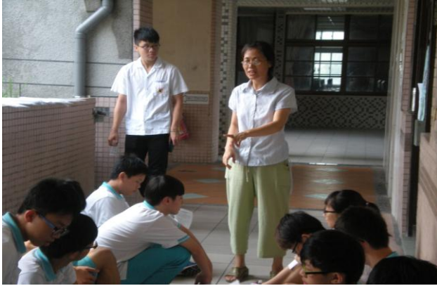
護理師講解檢查流程

主題：心臟病篩檢 時間：106年09月25日篩檢 106年10月19日補檢 地點：語言教室(一)