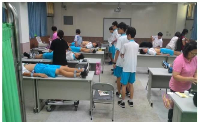
高中部男同學心臟病篩檢實況