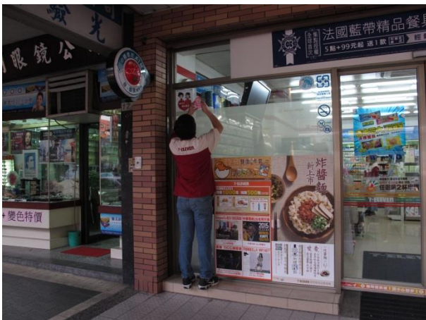
商店張貼本校愛心服務站情況