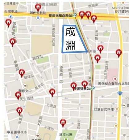
本校設置安心走廊據點概況