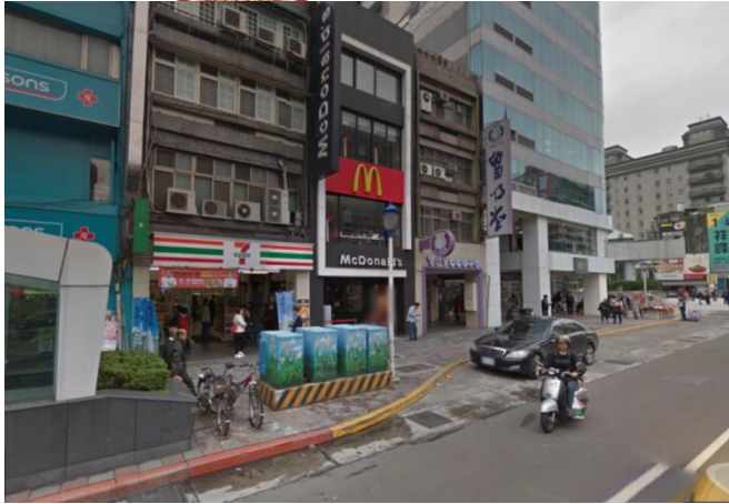
民權西路捷運站結盟 7-11 店家