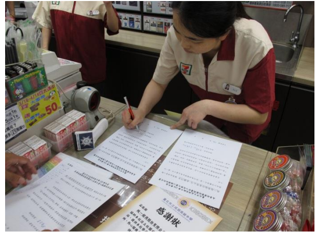
與店家締結合作關係情況