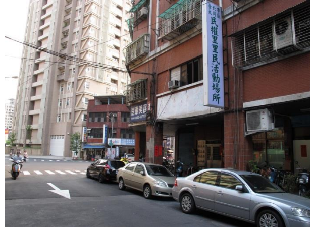
民權里里長辦公室設點概況