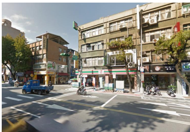
雙連街、民生西路交叉口商店概況