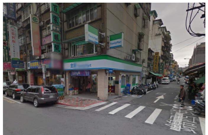
雙連捷運站旁商店概況