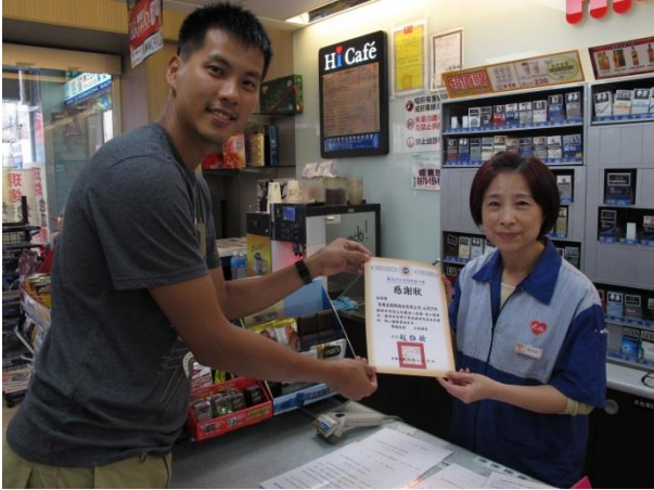
感謝鄰近商家共同營造社區安全