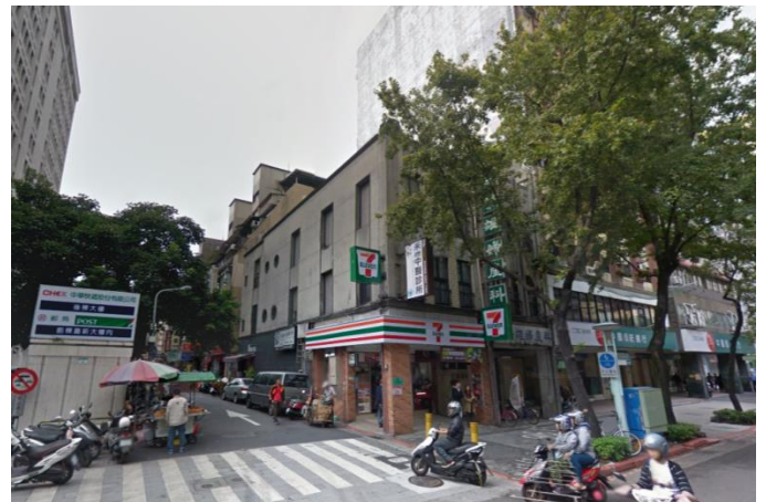
馬偕醫院中山北路上，鄰近市場及大馬路