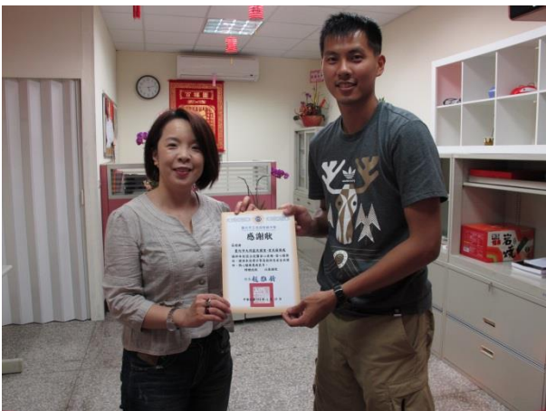
林里長大力支持校園安心走廊