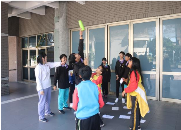
大小學伴團康時間