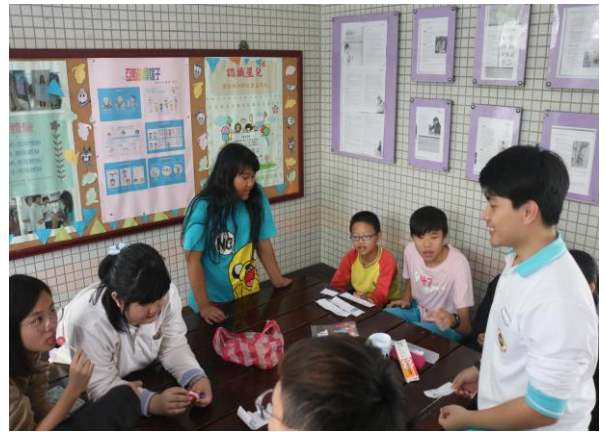
大小學伴團康時間