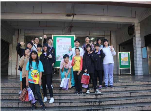
大小學伴合影留念