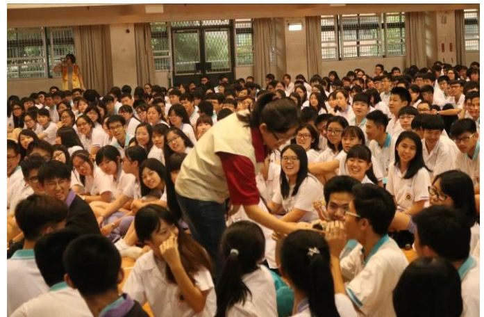
講師以互動的方式請學生分享