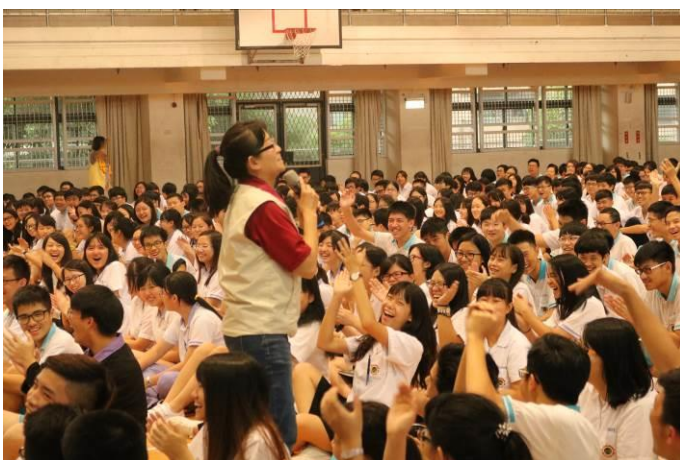
講座現場氣氛熱鬧