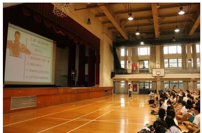
以同學喜愛的主題引發討論