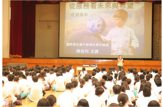
講師講座內容符合主題且貼近生活