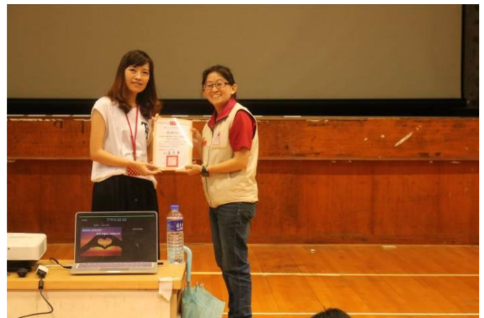
由學務主任代表學校致贈感謝狀