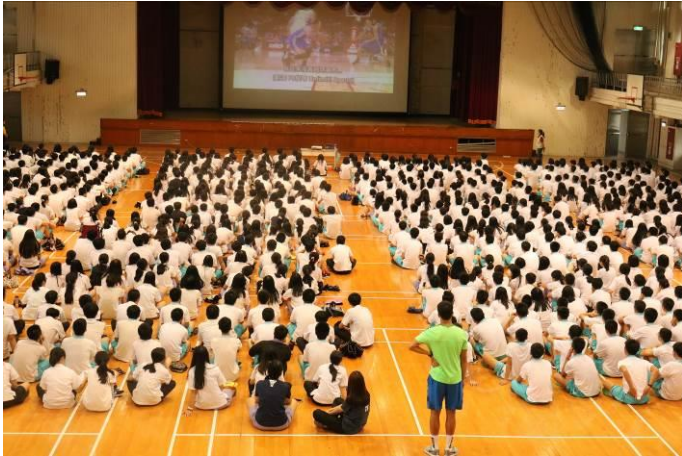
全體同學認真參與課程