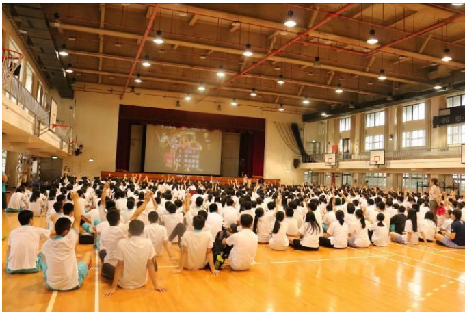
參與同學熱情回應