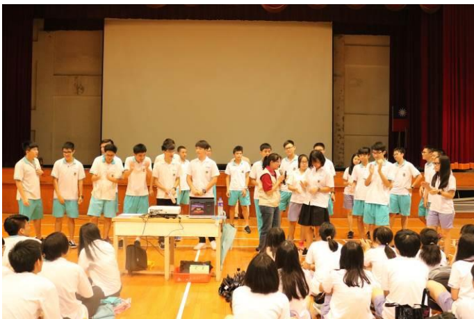
由學生主動上台分享講座心得