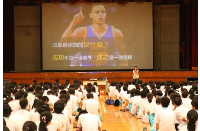
以適切標語鼓舞參與同學