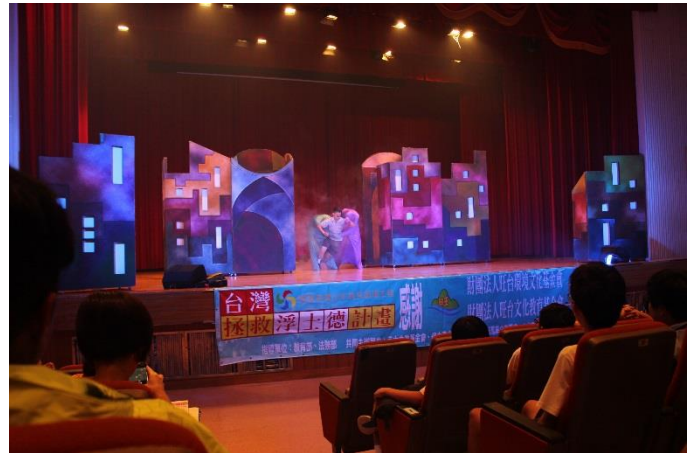
吸毒後果難以掙脫枷鎖