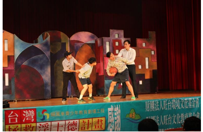
毒品害人又害己，警方絕對找上你