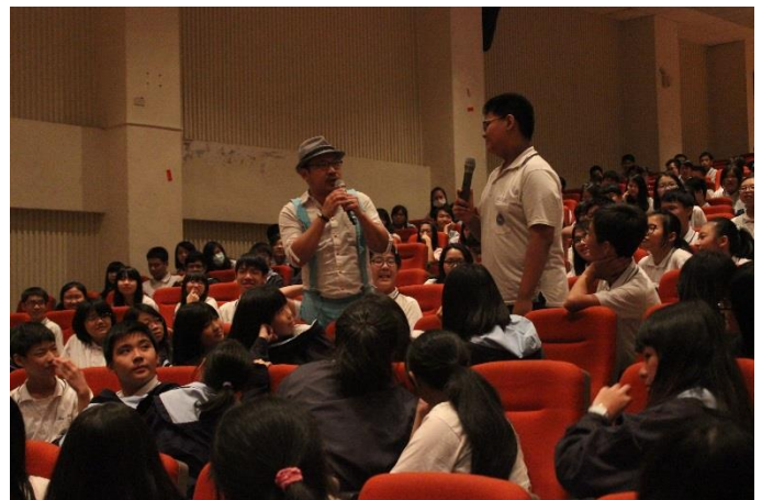
Q&A 同學踴躍回答問題