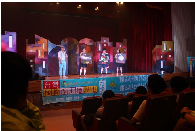
導演介紹毒品種類及圖示