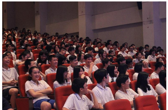
同學笑得合不攏嘴