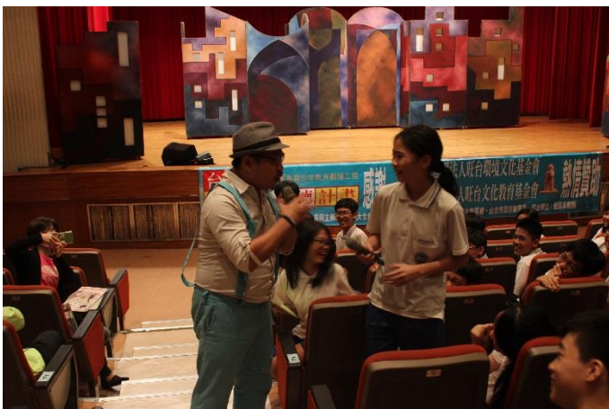
Q&A 同學踴躍回答問題