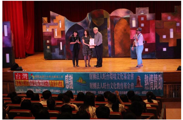
校長致贈感謝狀予旺台文化基金會