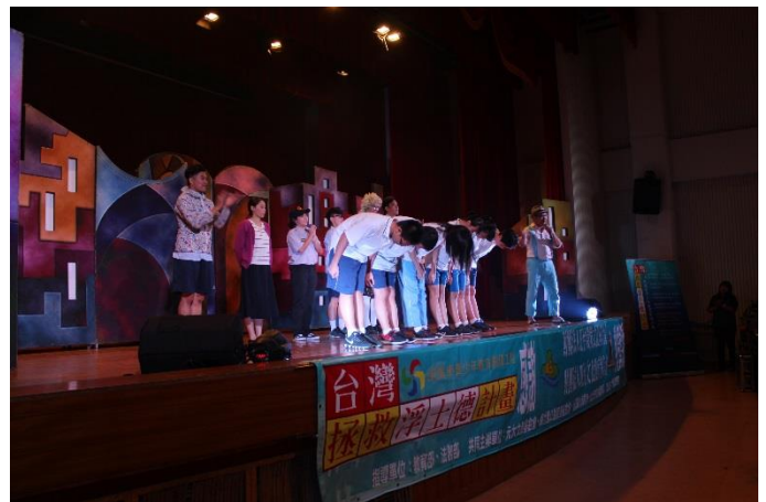
本校幕後及演出演員共同謝幕