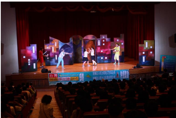
反毒宣導教育劇場開始