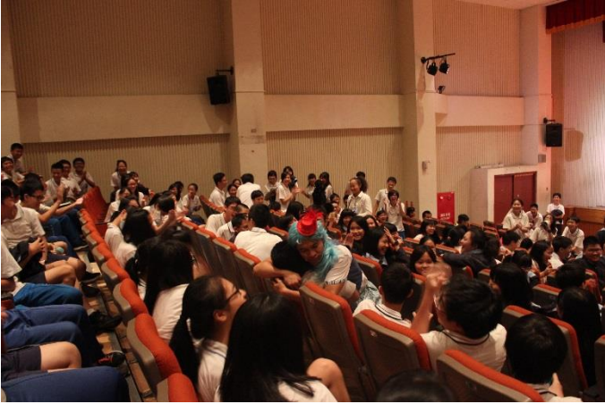
演員與台下同學進行互動

主題：友善校園- 紙風車青少年教育劇場 時間：105年11月8日 地點：三樓音樂廳