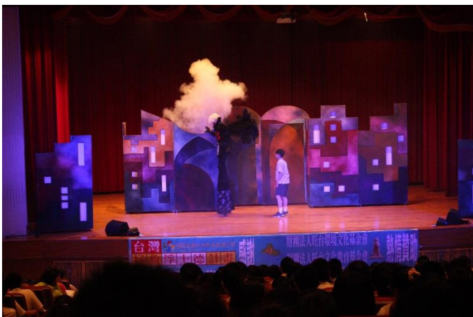
手持毒品的惡魔侵入學生