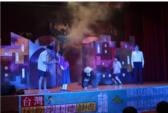
接觸毒品，讓你的人生從此黑白