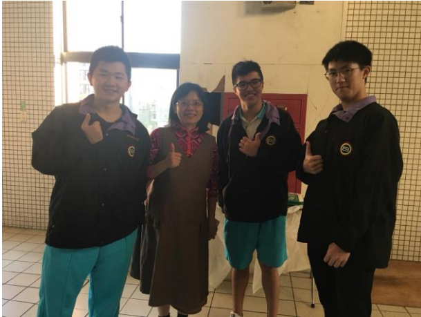
留下發問的學生與講師合影