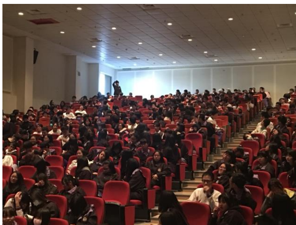
學生熱絡參與問答