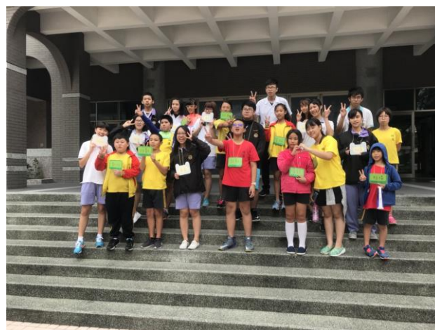
大小學伴合影留念