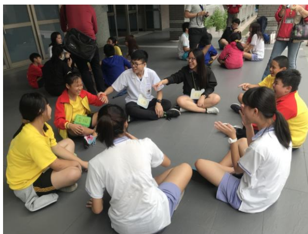
大小學伴團康時間