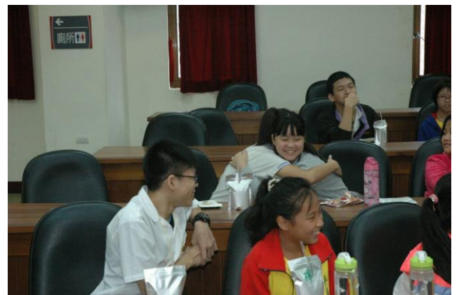
大小學伴熱絡互動