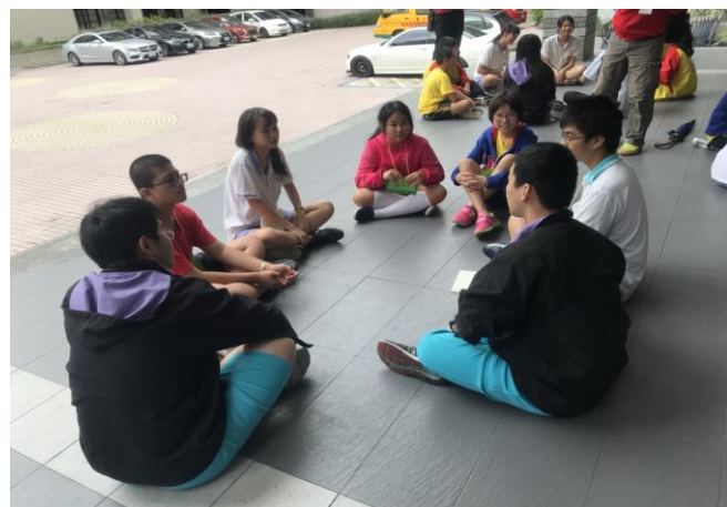
大小學伴團康時間