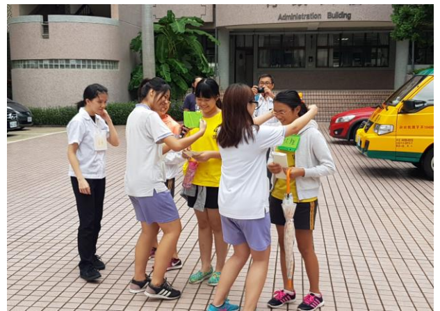
大學伴為小學伴掛上手做名牌