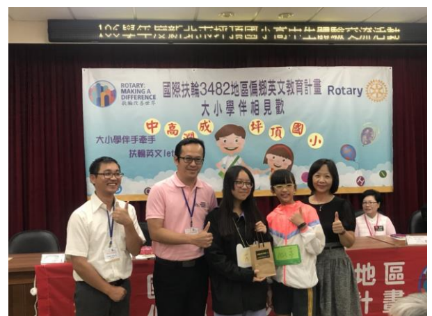
扶輪社致贈大小學伴禮物