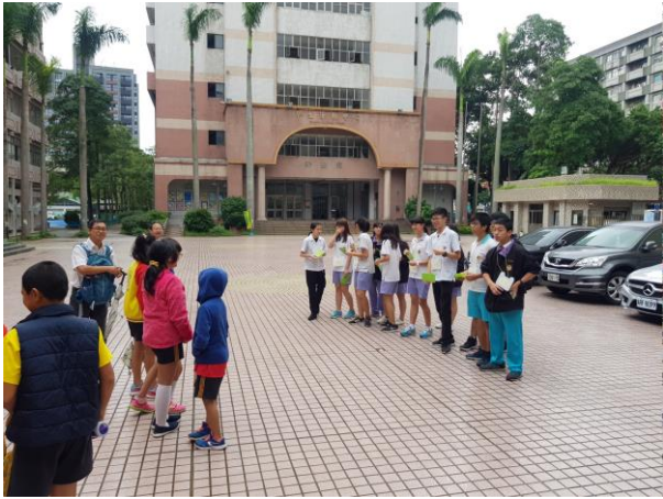
大學伴廣場迎接小學伴