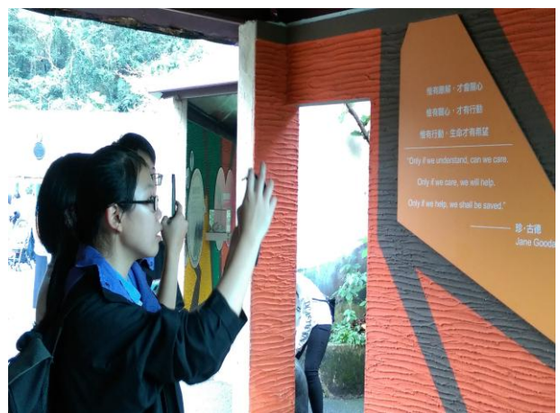
同學以相機記錄介紹說明