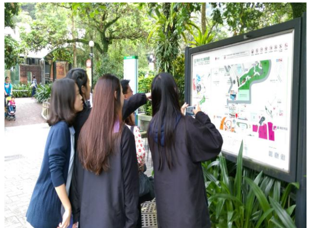
同學們開始入園參觀