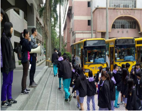
出發前集合及事項宣導