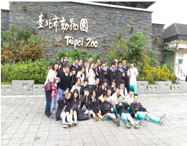
早到班級於動物園前合影留念