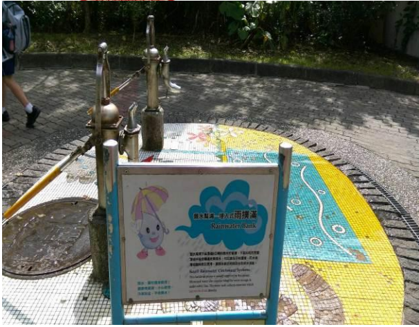
環保體驗-水撲滿解說牌