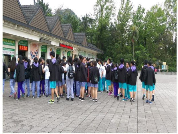
同學依序進入動物園