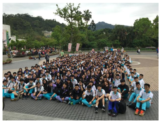
全體同學與師長於動物園廣場合影