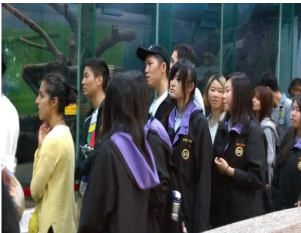
同學在貓熊館參觀