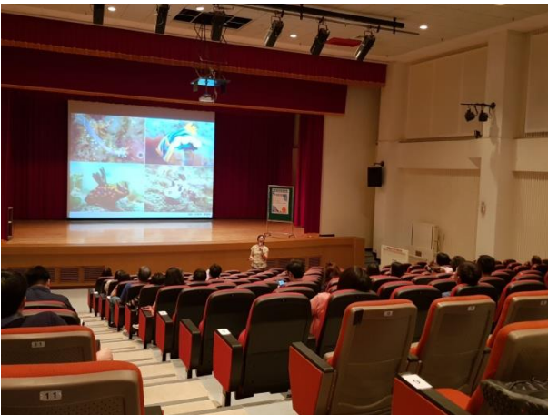
講師介紹海洋特殊生物