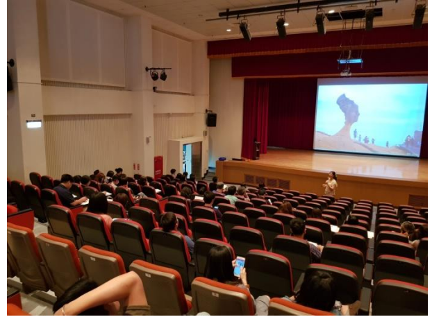
野柳女王頭之介紹