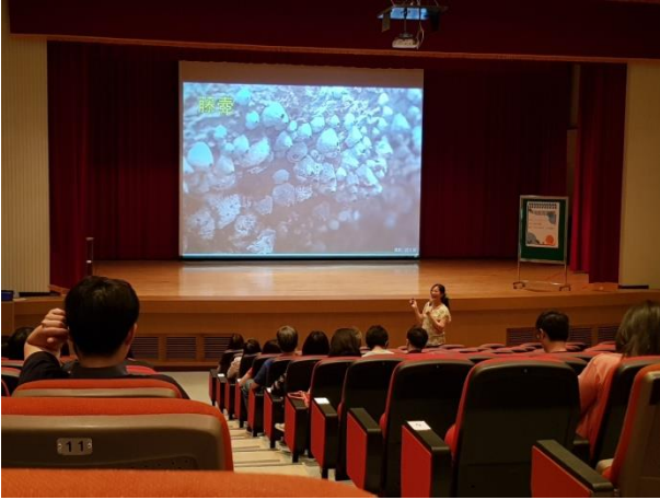
介紹潮間帶藤壺生長狀況