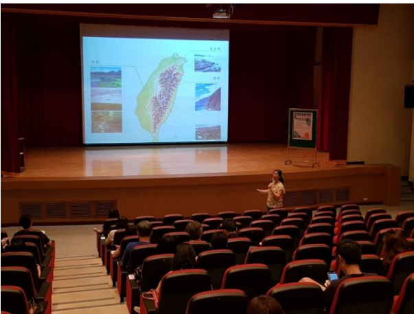
介紹台灣海邊風景