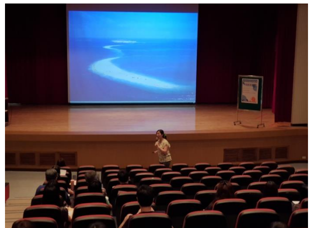
講師說明海洋目前面臨之危機