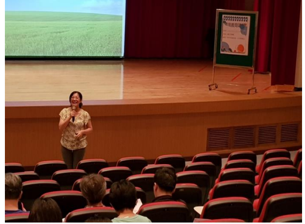
講師介紹如何踏入海洋保育