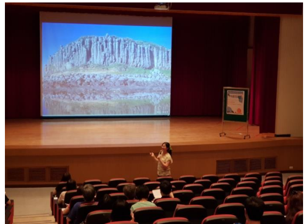
介紹離島金門玄武岩