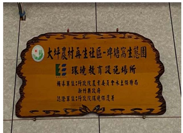
九芎湖環境教育園區