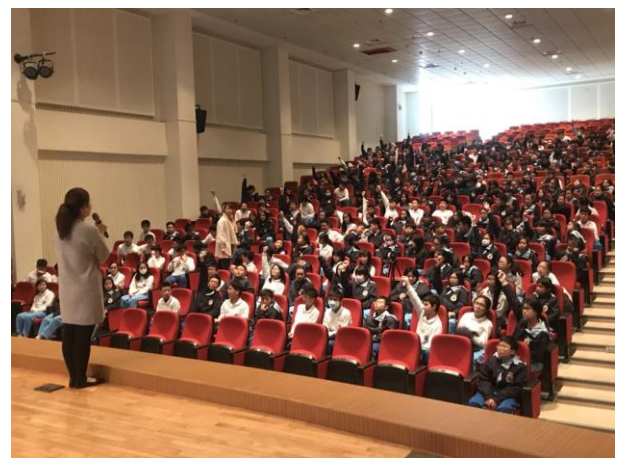
學生熱絡參與有獎徵答