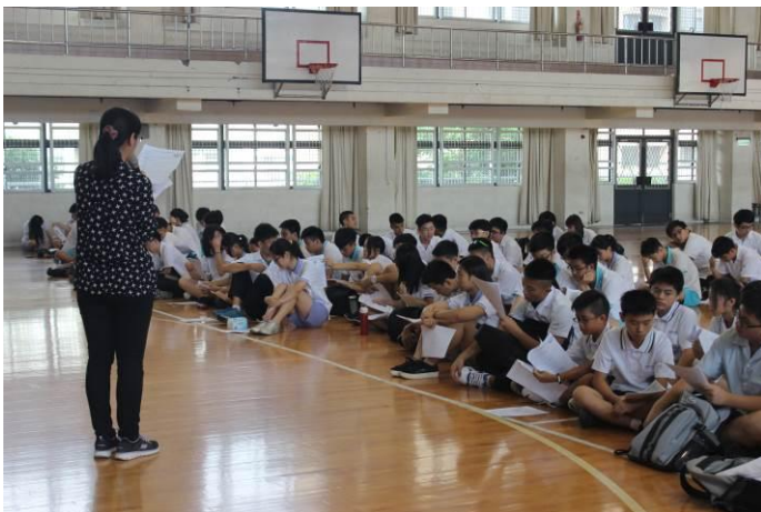
衛生、環保幹部訓練情形