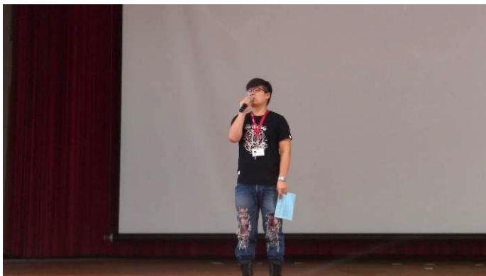
幹部訓練宣導情形