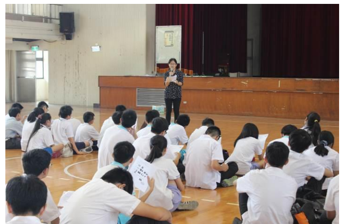
幹部訓練宣導情形