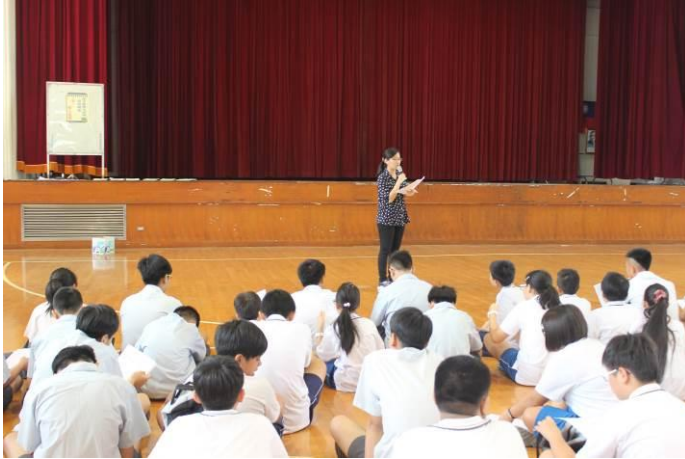
衛生、環保幹部訓練情形

主題： 衛生、環保學生幹部訓練 教育宣導 時間： 105年8月29日 地點： 活動中心5樓