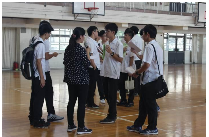
衛生、環保幹部訓練後學生提問