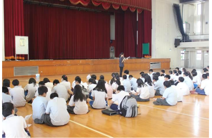
衛生、環保幹部訓練情形