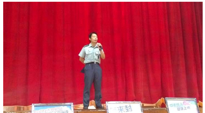
幹部訓練宣導情形