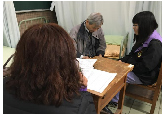
醫師問診健康狀況