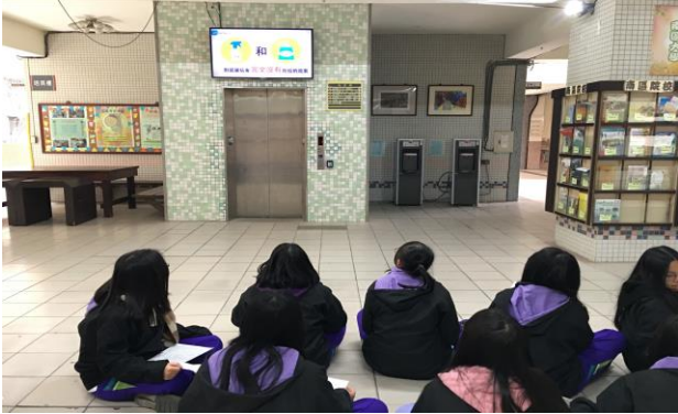
等待時播放衛生教育影片宣導