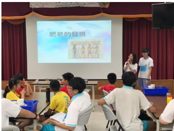
手做課程-肥皂製作