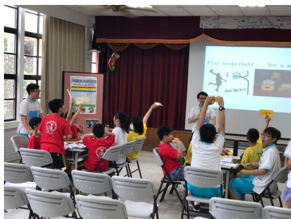
小學伴踴躍回答問題