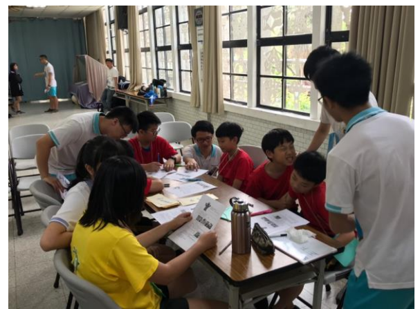
大小學伴合作學習