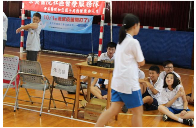
休息區觀察 10 分鐘