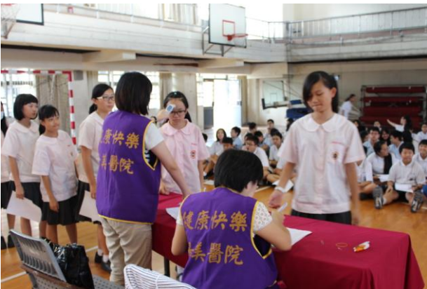
測量額溫、紀錄溫度