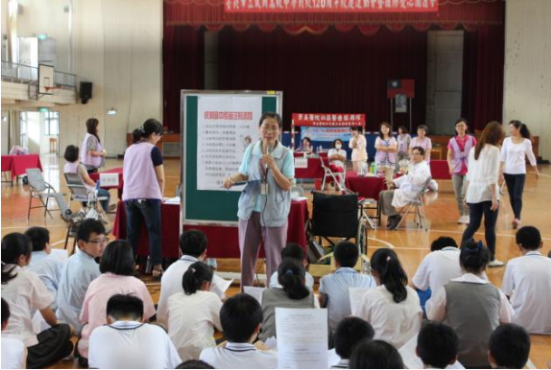
流感疫苗注射流程說明