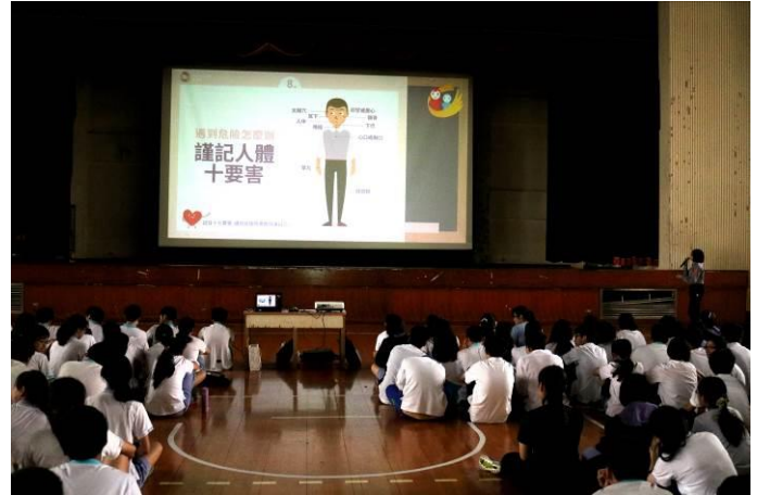
面對危險時的自我保護