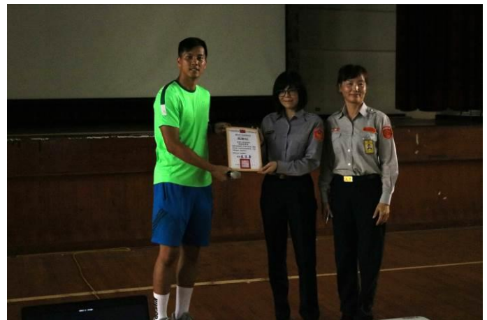
由生教組長代表學校致贈感謝狀