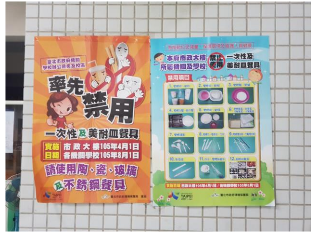
合作社禁用一次性餐具宣導