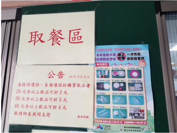
熱食部禁用一次性餐具宣導