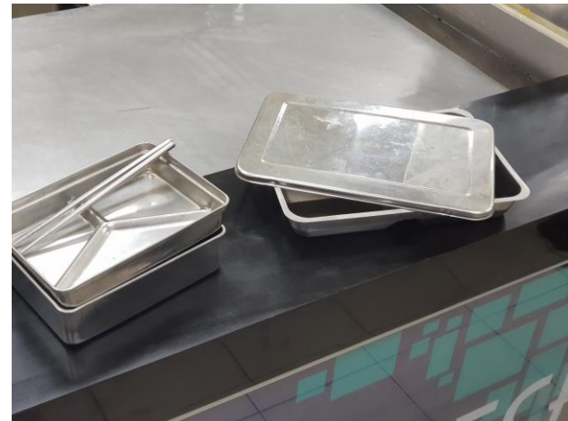
熱食部使用不銹鋼環保餐盒、筷