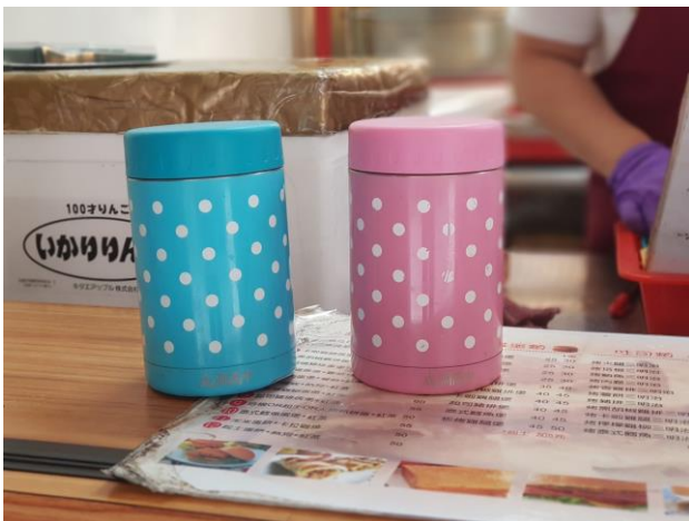
早餐部使用環保杯盛裝飲料