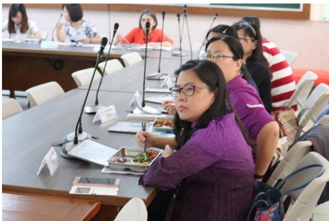
校內會議餐盒皆使用環保餐具組