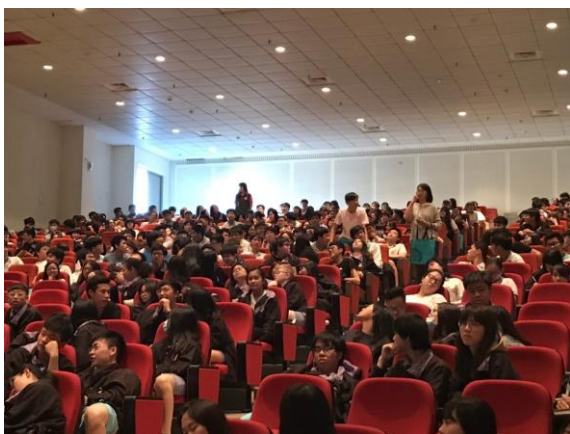
有獎徵答互動熱絡