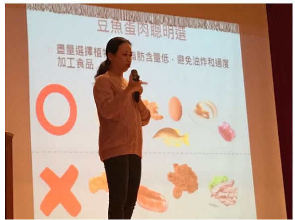
介紹均衡飲食原則