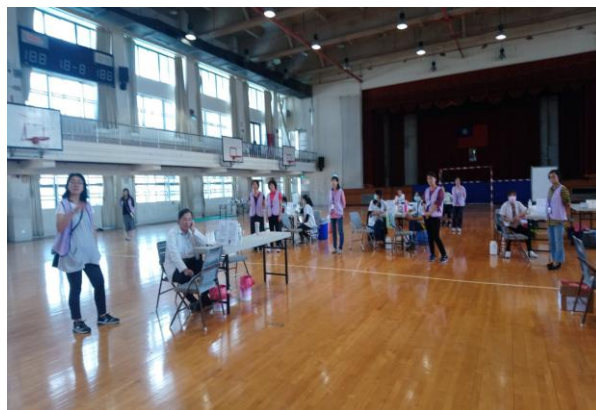
流感疫苗注射動線