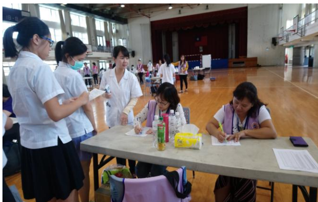
測量額溫、紀錄溫度