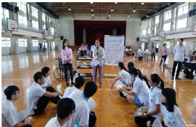
流感疫苗注射流程說明