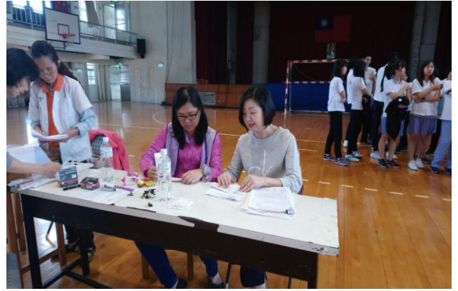
休息區觀察 10 分鐘