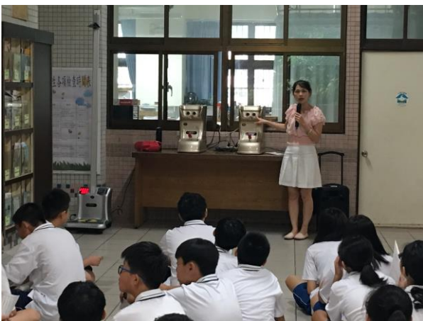
介紹視力儀操作方式