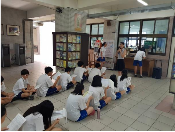
視力檢查前說明流程