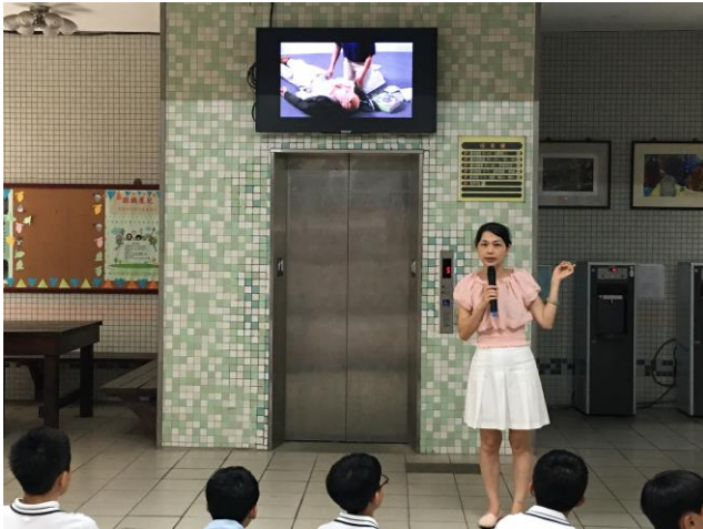
CPR 及 AED 衛教宣導