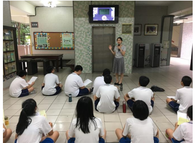
CPR 及 AED 衛教宣導