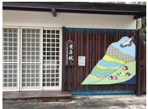
貴子坑水土保持教育園區