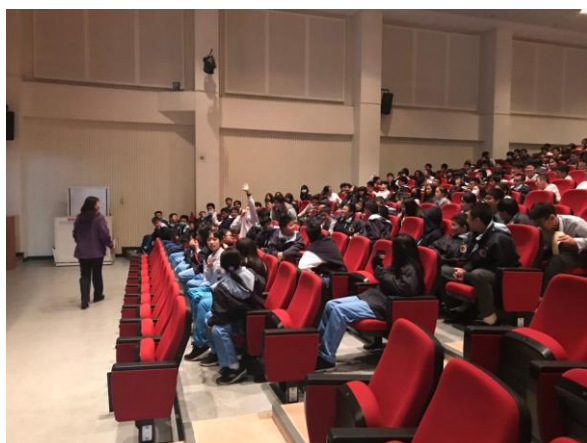
有獎徵答互動熱絡