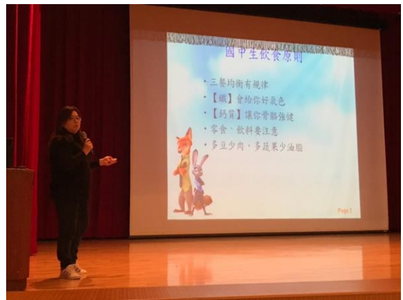
介紹均衡飲食原則