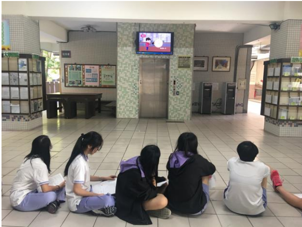
等待檢查觀看衛教宣導影片