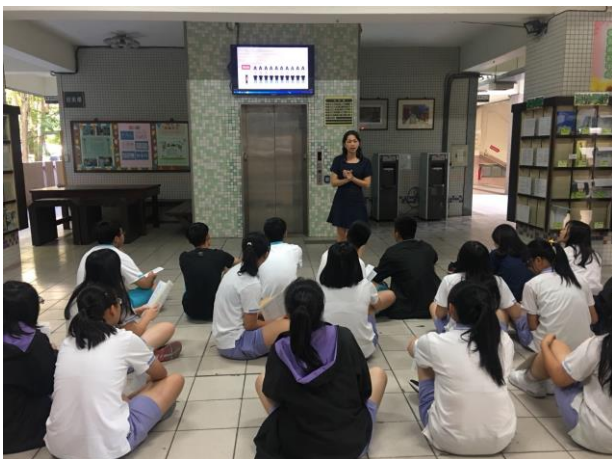
視力檢查衛生教育宣導