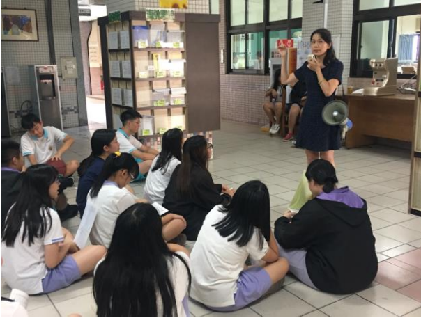
視力檢查前說明流程