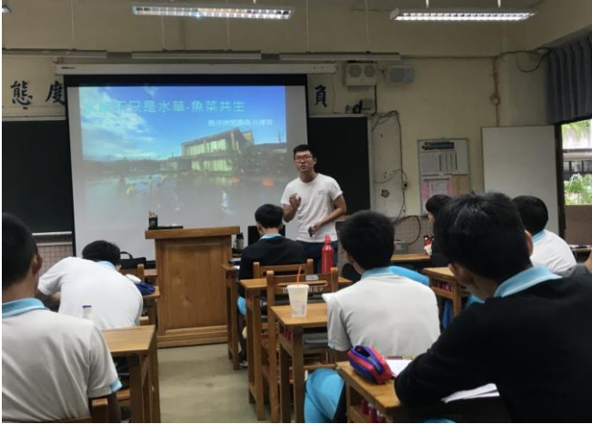
講師介紹背景經歷

主題： 小田園魚菜共生研習 時間： 106年10月23-24日 地點： 倫理樓五樓教室