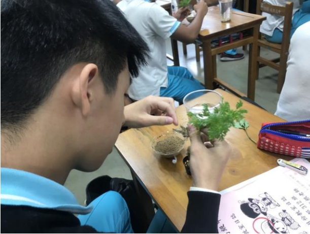
學生認真操作模樣

主題： 小田園魚菜共生研習 時間： 106年10月23-24日 地點： 倫理樓五樓教室