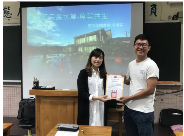
致贈感謝狀予講師