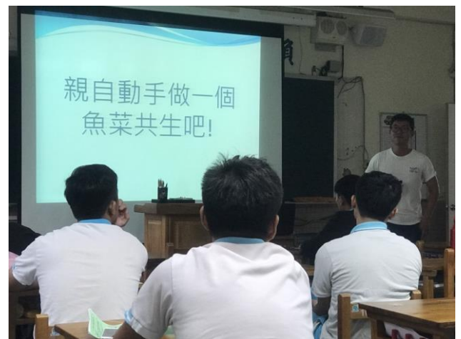
動手操作簡易型魚菜共生