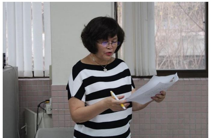
熱食部業者回應委員們的問題情形