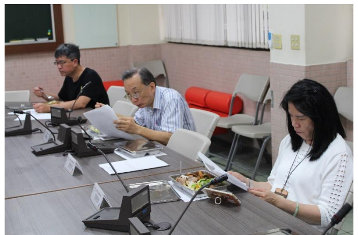
委員查看膳食調查內容表資料情形