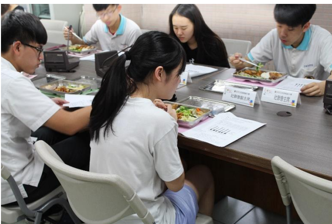
委員查看膳食調查內容表資料情形