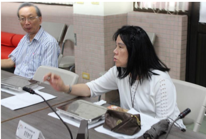
家長會代表與會討論情形