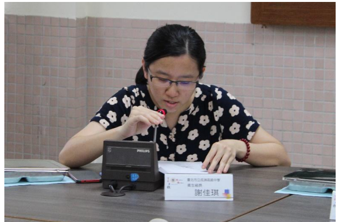
佳琪組長說明學生膳食調查表內容情形