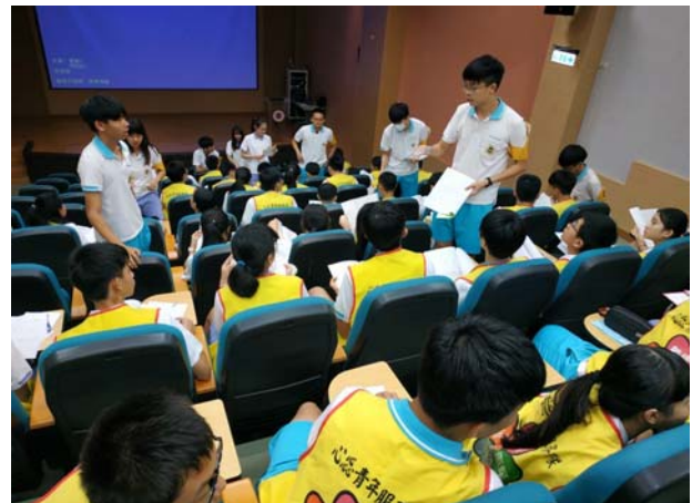
各隊分組討論工作情形 02