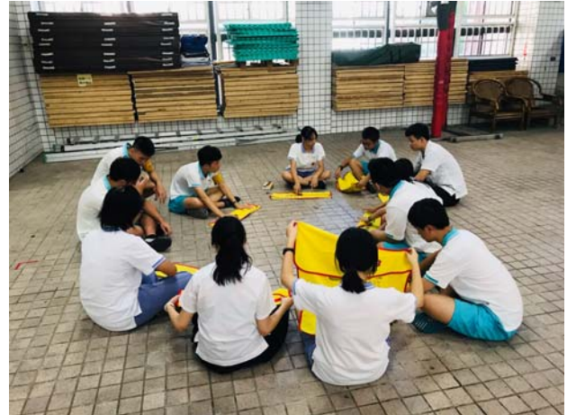
幹部教導新生如何折疊服務背心