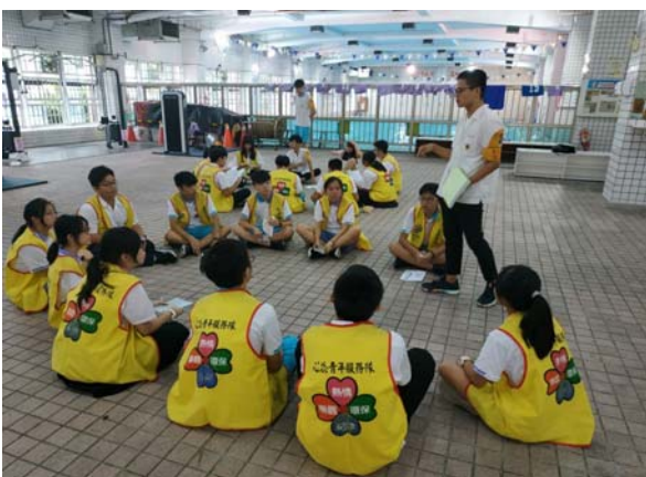
各隊分組討論工作情形 03