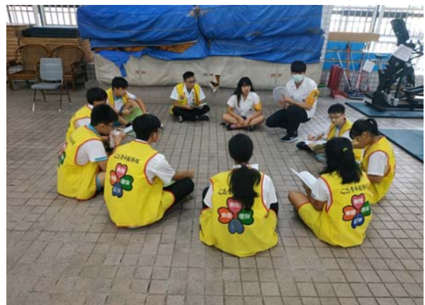
各隊分組討論工作情形 04