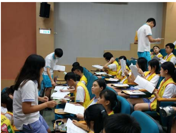
各隊分組討論工作情形 01