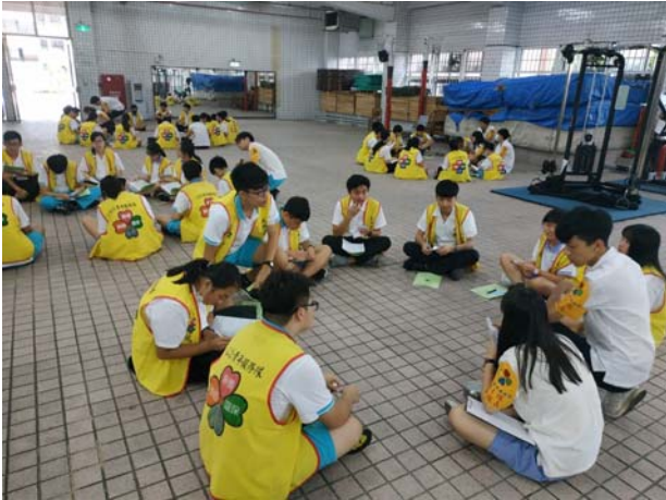
各隊分組討論工作情形 05