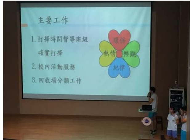
新任心崧服務隊上課情形