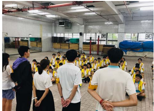
衛生組長進行結訓勉勵