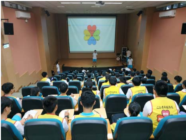
大隊長就評分原則實施說明

主題： 心崧青年服務隊教育訓練 時間： 108年9月2-5日 地點： 活動中心1樓、多媒體教室