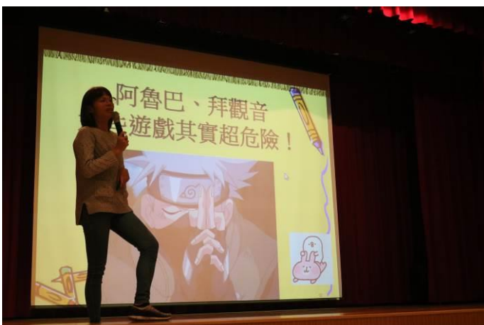
講師以生活中常發生的狀況切入主題