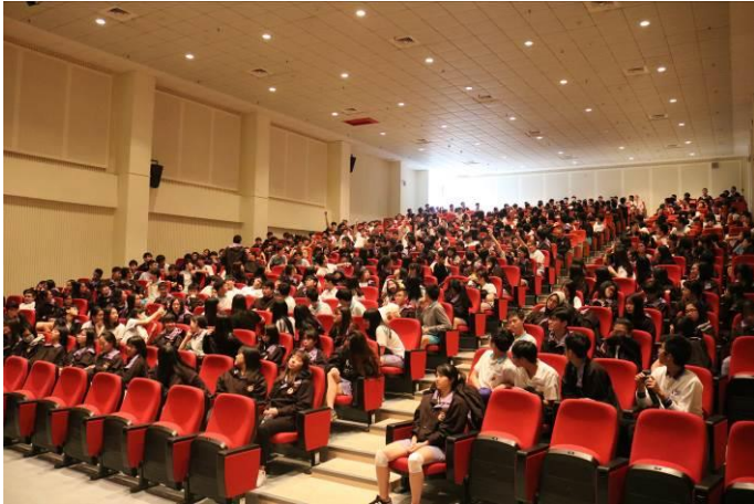
同學踴躍分享個人看法