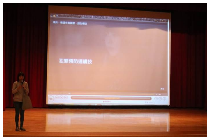
由不同影片引導同學思考