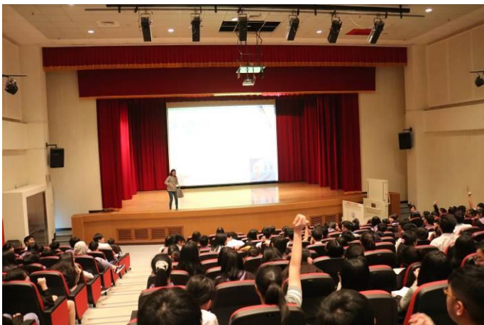
同學積極參與講座活動