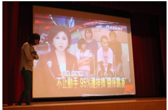
講師藉由新聞事件討論相關主題