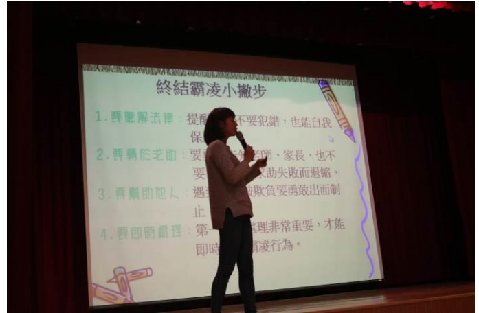
在短片結束後，探討相關問題