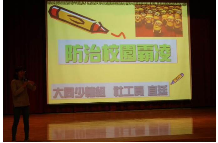
由大同少輔組社工主講法治教育議題