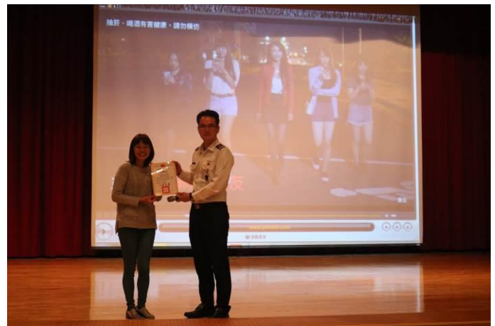
由生輔組長代表學校致贈感謝狀