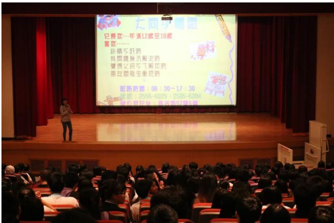
講師親切向學生宣導