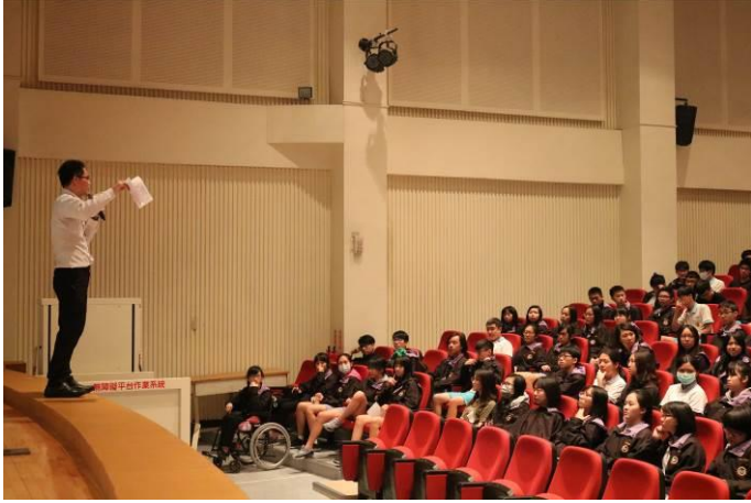
由生輔組長為本次精彩講座開場