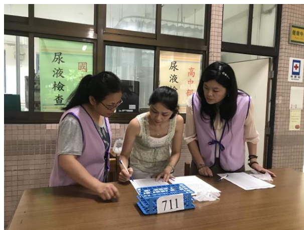
教導志工協助檢體收集