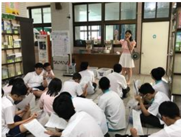
教導繳交班級尿液檢體注意事項