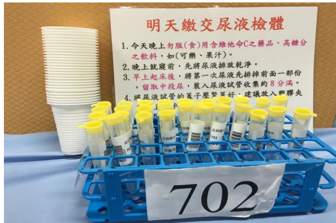
各班尿液放置情形