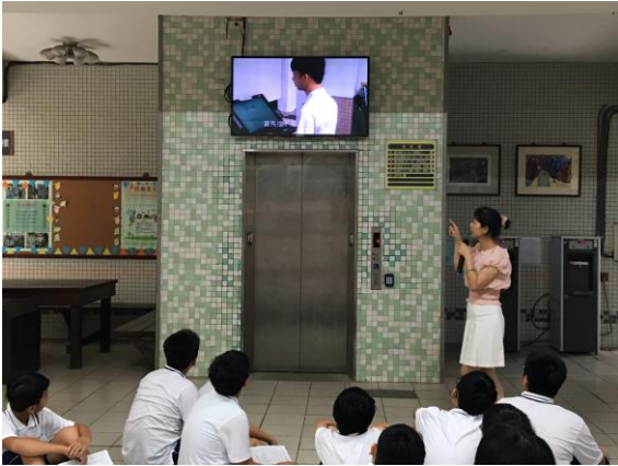
新生掛號系統教學