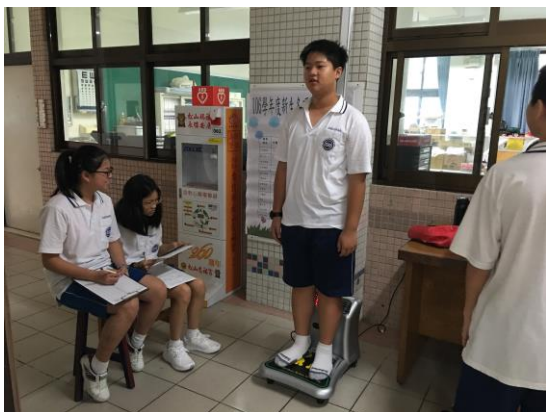
身高體重檢查實況