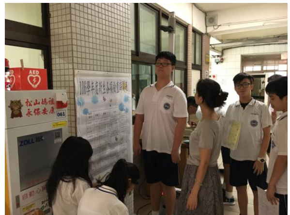
身高體重檢查實況