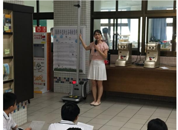
說明身高體重檢查注意事項