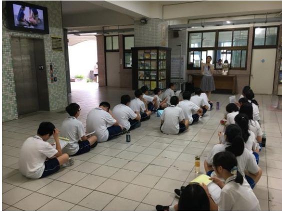
身高體重檢查前說明流程