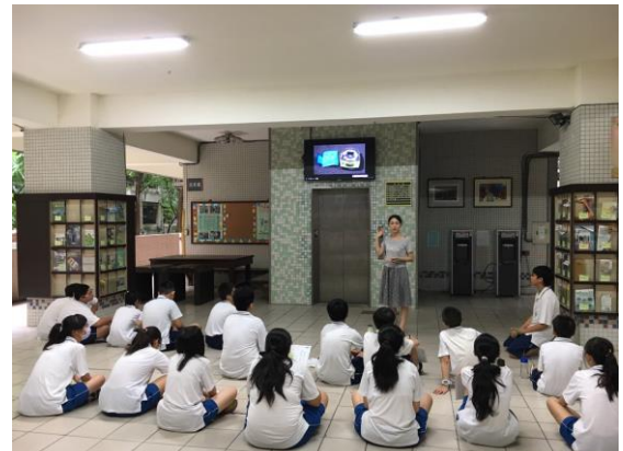
CPR 及 AED 宣導