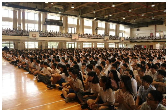
精彩分享獲得滿堂彩