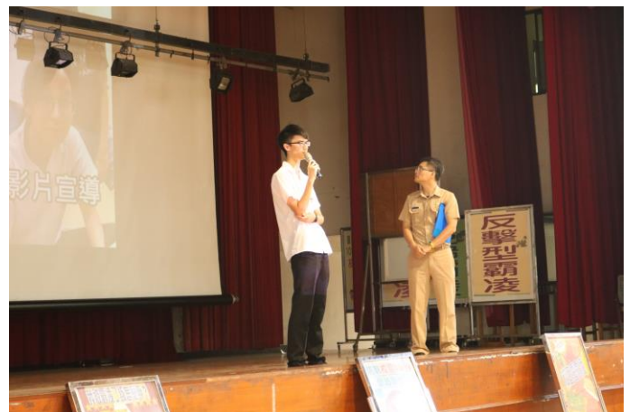
春暉社社長宣導反毒影片