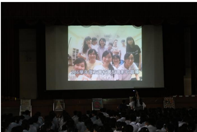
透過影片培養學生正確的生活態度