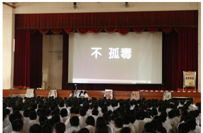
絕不因任何因素嘗試毒品