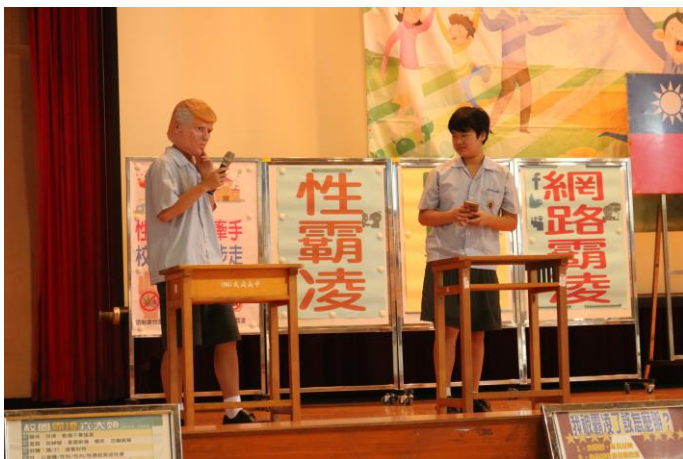
同學切和主題，演出活潑短劇