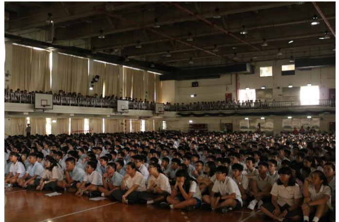
同學專心欣賞高中部同學製作的微電影