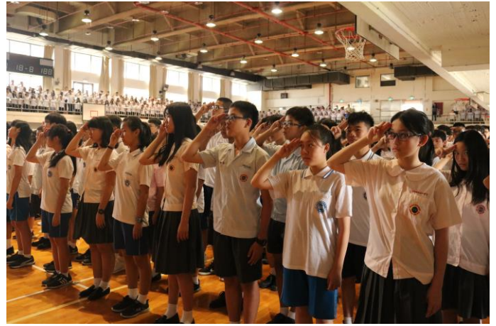
全校學生精神抖擻迎接開學