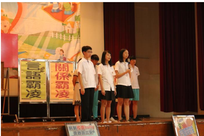
高中部友善校園種子鼓勵學弟妹