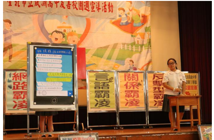
話劇主題與生活息息相關