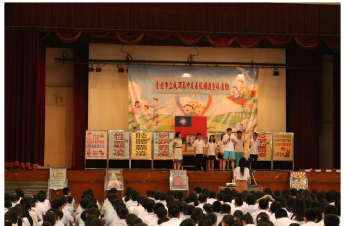
高中部學生友善校園心得分享