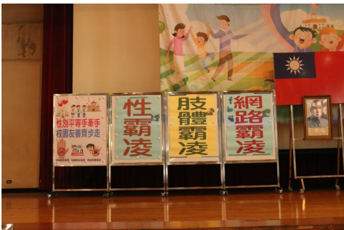
拒絕校園霸凌，建構友善校園