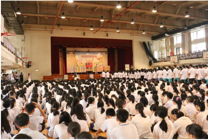
全校學生參與友善校園討論

主題： 友善校園-友善校園週 反毒反黑反霸凌 時間： 106年8月30日 地點： 活動中心五樓