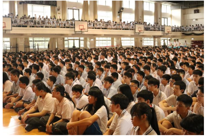
同學分享校園霸凌可能發生的情況