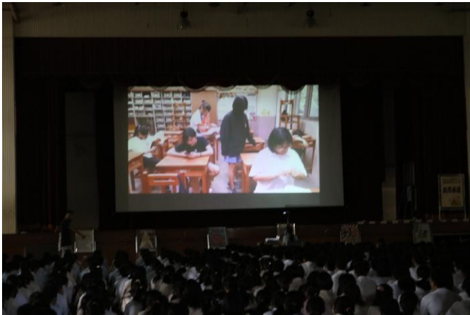
高中春暉社反毒微電影

主題：友善校園-友善校園週 反毒反黑反霸凌 時間：106年8月30日 地點：活動中心五樓