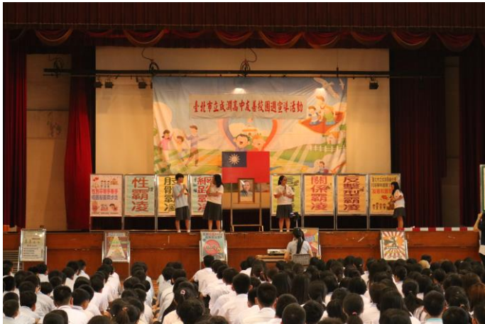
國中部反霸凌話劇演出

主題： 友善校園-友善校園週 反毒反黑反霸凌 時間： 106年8月30日 地點： 活動中心五樓