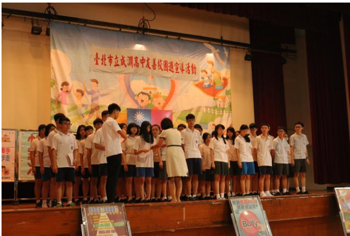
表揚推動友善校園種子