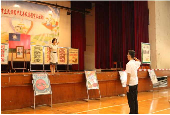
開學典禮暨友善校園宣導週開始

主題：友善校園-友善校園週 反毒反黑反霸凌 時間：106年8月30日 地點：活動中心五樓