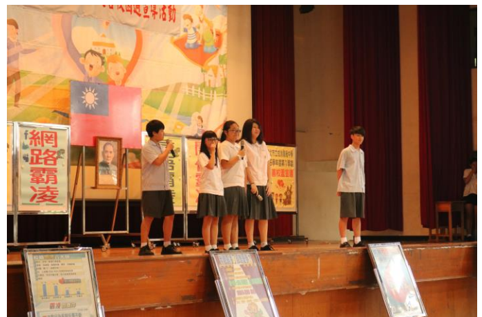
國中部同學自創口號反霸凌